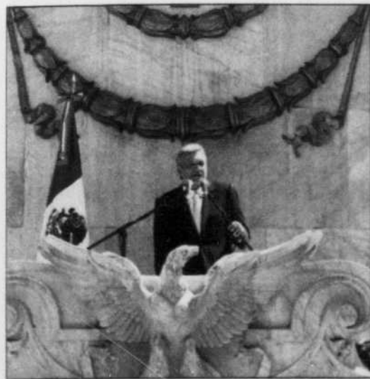
Andres Manuel López Obrador