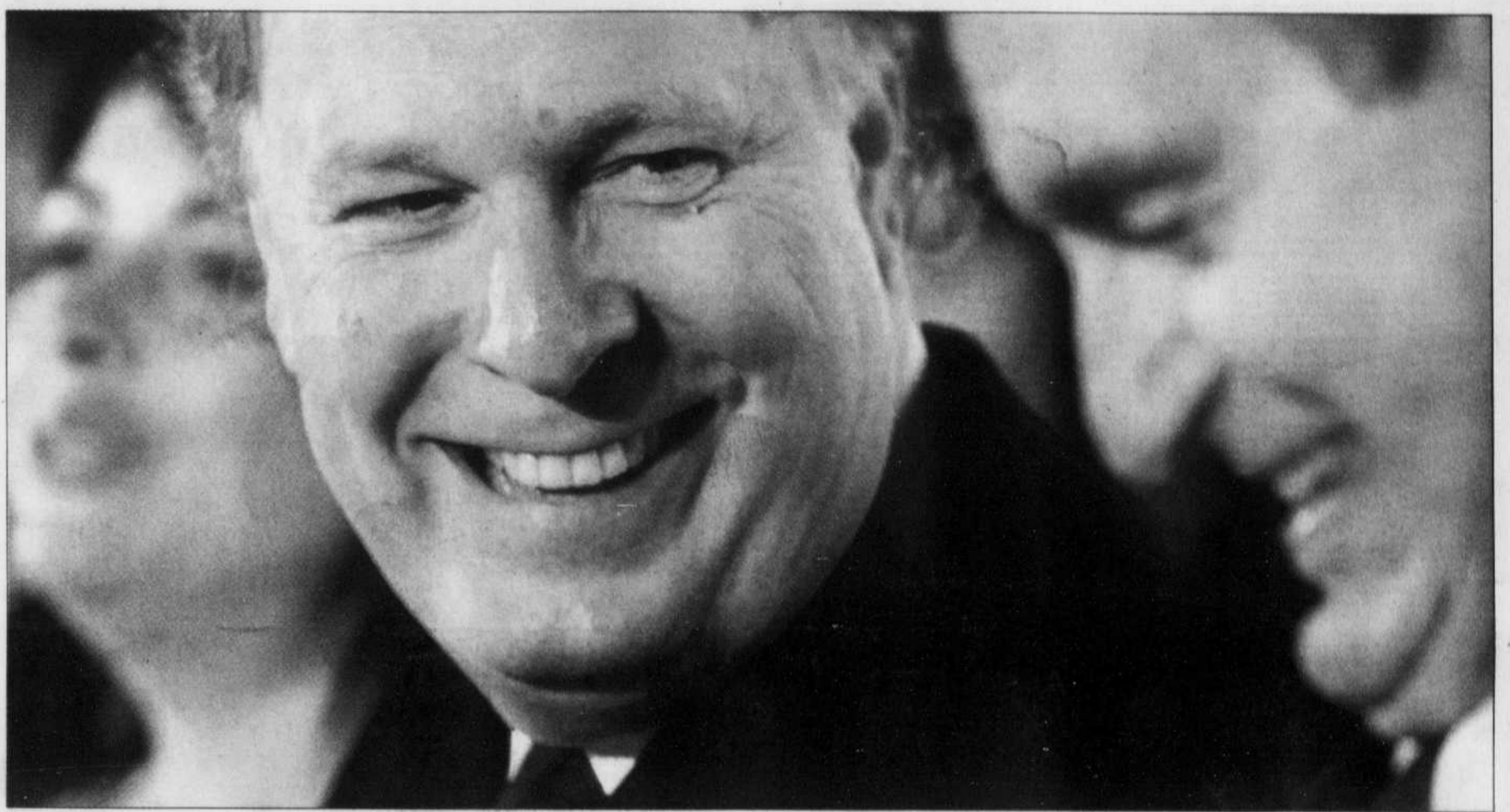
Le premier ministre Jean Charest en compagnie du président du conseil d'administration de l'Orchestre symphonique de Montréal, Lucien Bouchard, et de la ministre de la Culture et des Communications, Line Beauchamp, lors de l'annonce officielle du projet de construction de la nouvelle salle de l'OSM, hier.