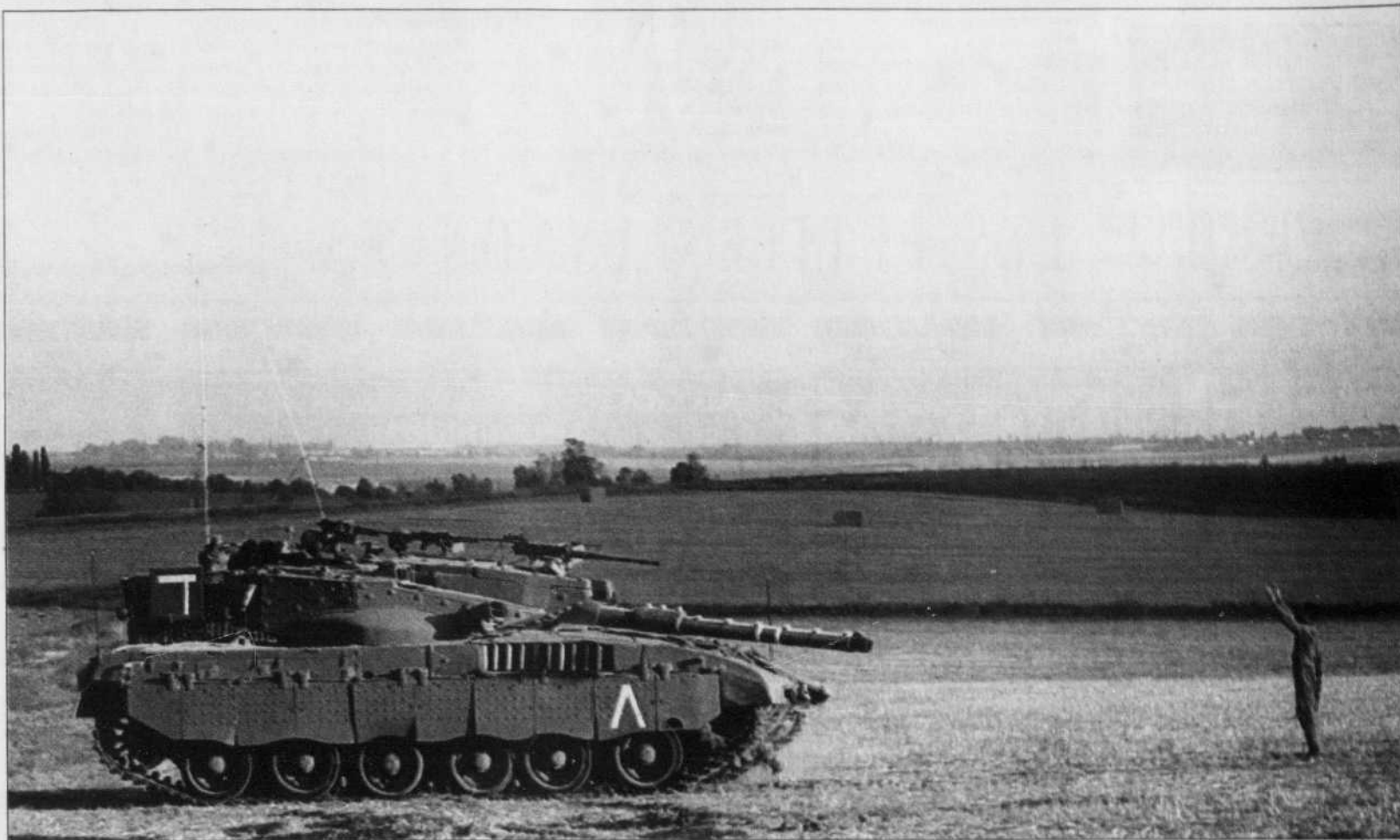
Un soldat israélien dirigeait un char d'assaut hier dans la région de Mesalim.

Selon la télévision publique, les efforts en vue d'obtenir la libération par la négociation du soldat