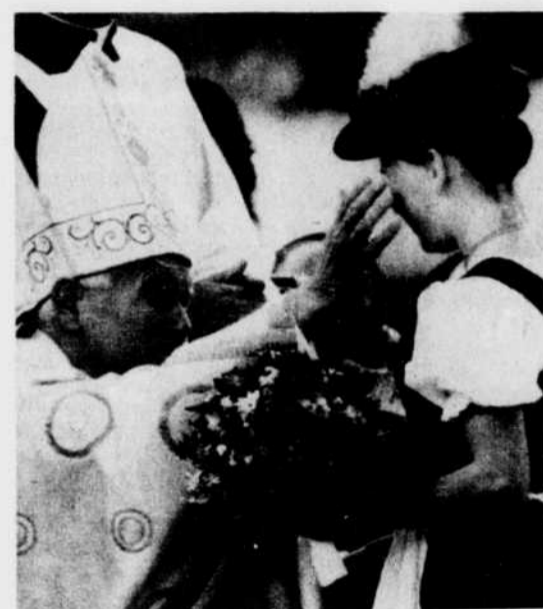
Jean-Paul II, au Stade olympique de Munich, hier.

Hier matin, devant 75.000 Bavarois réunis au stade olympique de Munich, Jean Paul II avait prononcé la béatification de Ruper Mayer, jésuite muni-chois anti-nazi, trois fois emprisonné sous Hitler pour avoir refusé de renoncer à ses sermons contre "l'idéologie anti-religieuse national-socialiste".