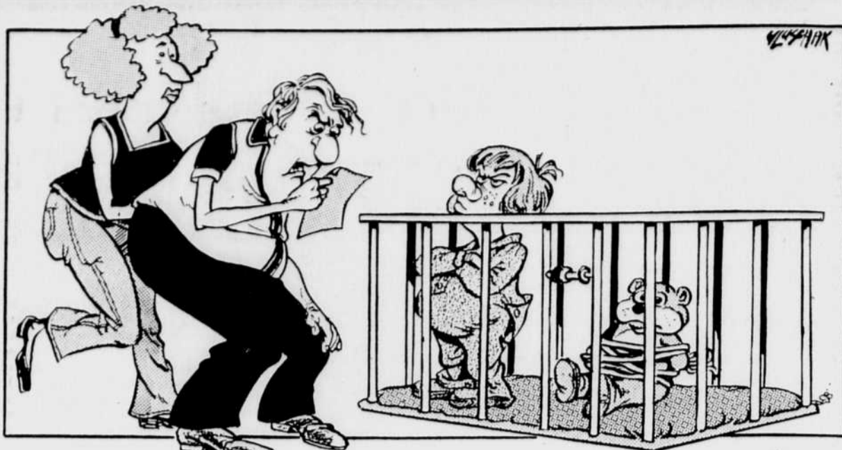
C'est écrit qu'il gardera son ours en otage tant que le Canada n'aura pas un bon réseau de garderies!