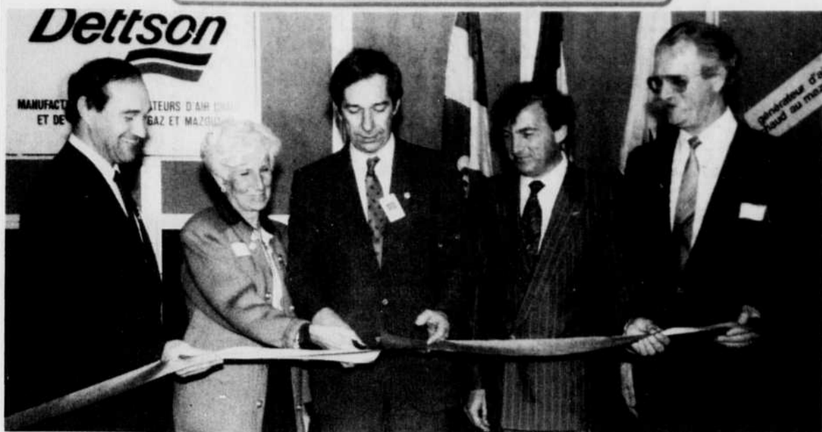
Les Industries Dettson inaugurent leur nouvelle usine