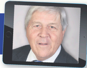
BERTRAND LAMOUREUX Maire Ville de Coaticook