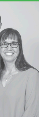
Techniques d'éducation du conseil d'adminis-