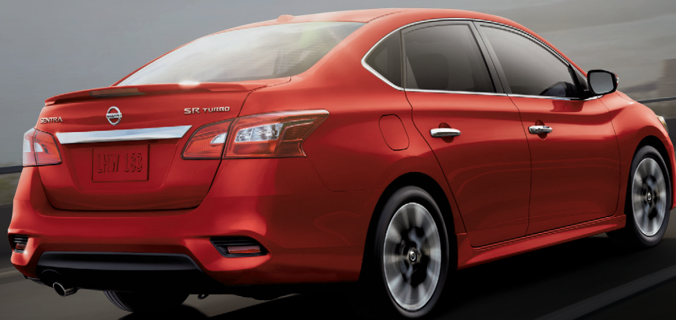
Sentra SR turbo illustrée *

de rabais au financement à un taux standard sur les modèles 2017 sélectionnés. (Le rabais de 5 000 $ s'applique aux modèles Altima et Maxima.)