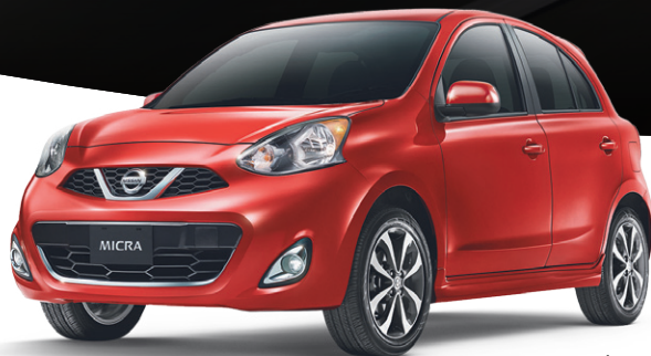
Micra SR illustrée *

AU FINANCEMENT À UN TAUX STANDARD (sur les Sentra SR Turbo).