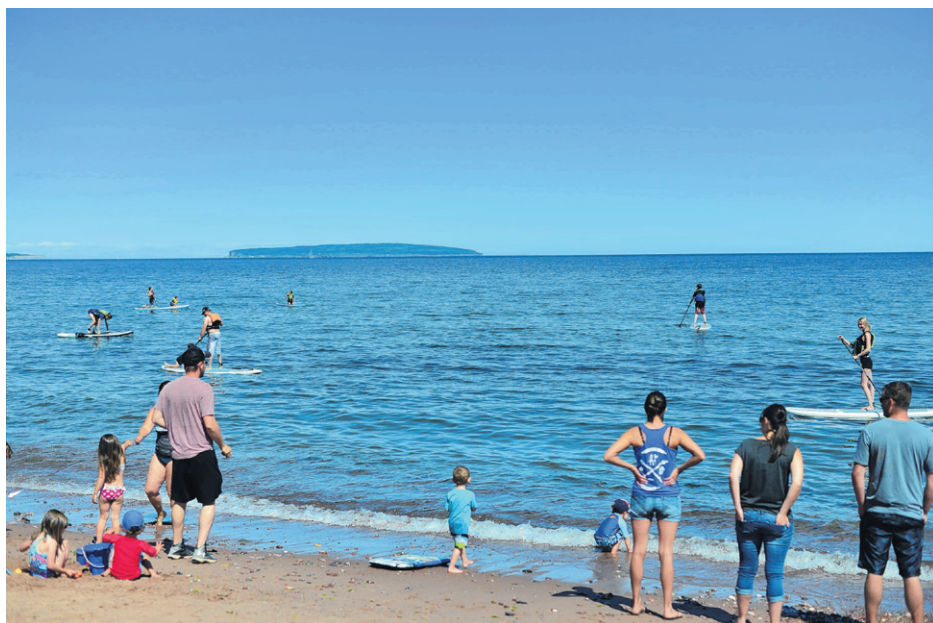
Le paddle board était une nouveauté cette année.

Par ailleurs, Ghislain Pitre ne pouvait pas passer