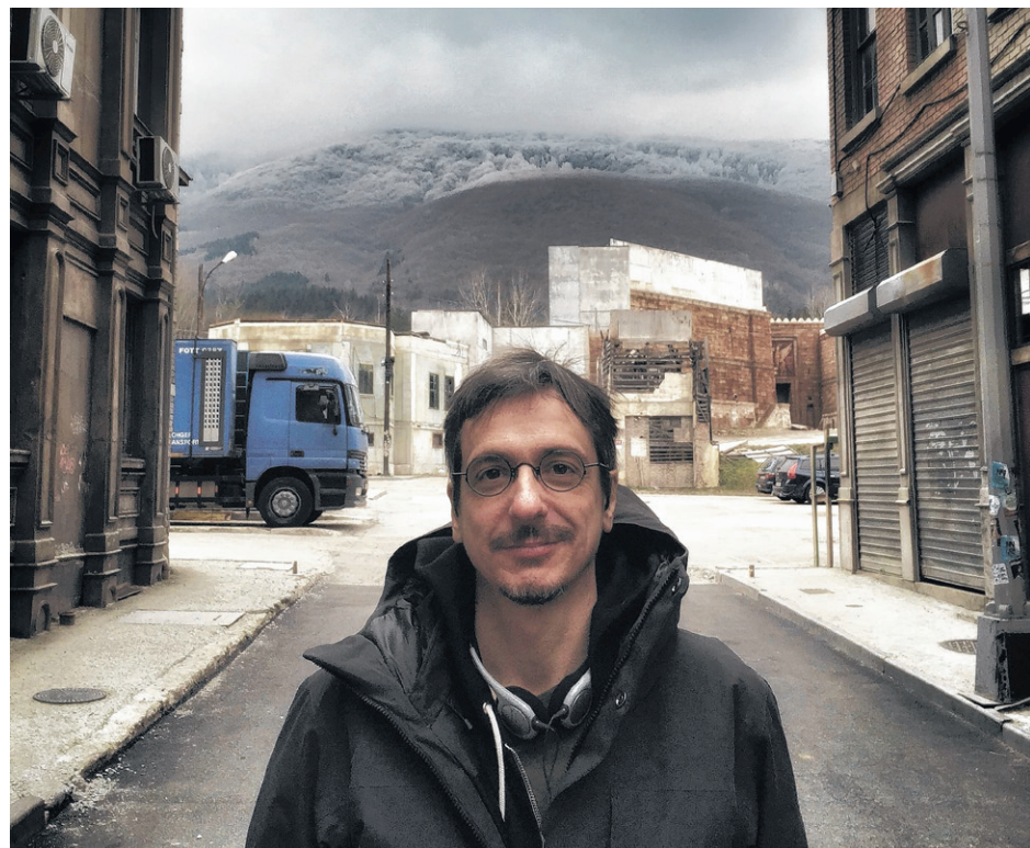
Pour sa première présence au Festival Les Percéides, le réalisateur présentera à Percé une classe de cinéma d'auteur portant sur son long métrage Monsieur Lazhar.

Pour sa première présence au Festival Les Percéides, le réalisateur présentera à Percé une classe de cinéma d'auteur portant sur son long métrage Monsieur Lazhar , qui a notamment obtenu le prix du meilleur film canadien au Toronto International Film Festival. Adapté de la pièce de théâtre de l'auteure québécoise Évelyne de la Chenelière, le film suit le parcours de Bashir Lazhar (interprété par Mohamed Fellag), un immigrant algérien vivant à Montréal embauché comme enseignant dans une école primaire afin de remplacer sa prédécesseuse s'étant enlevé la vie. Durant cette classe de maître, Philippe Falardeau parlera de son travail de création, de scénariste et de réalisateur, présentera des séquences d'images inédites du film tournées lors des auditions et s'entretiendra avec le public du festival. Une occasion en or à saisir et à ne pas manquer pour tout bon cinéphile ou tout bon cinéaste de la Gaspésie. Rappelons que le Festival se déroulera sur le site de la Vieille Usine de l'Anse-à-Beaufils du 23 au 27 août.