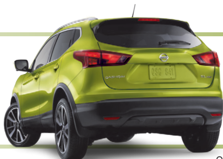
Qashqai SL Platine illustrée*

de rabais au financement à un taux standard