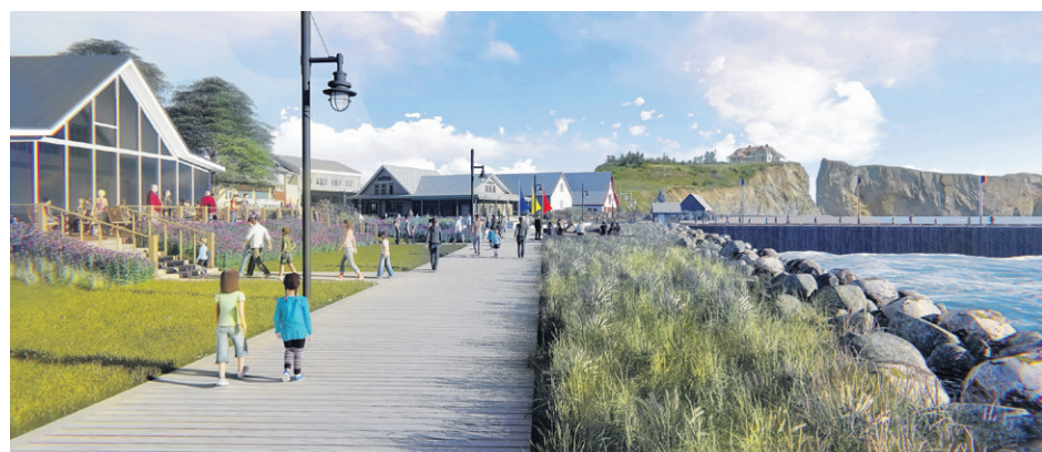
Voici le visage anticipé du littoral de l'anse du sud après la complétion des travaux en 2018.

nouvelle promenade et d'aménagements récréotouristiques qui moderniseront le visage du centre-ville pour les saisons touristiques à venir. Le coût de cette deuxième phase n'a pas été dévoilé, puisque la Ville ira en appel d'offres éventuellement.