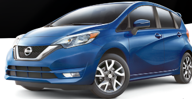
Versa Note SR illustrée*

de rabais au financement à un taux standard (excluant le modèle S à boîte manuelle)