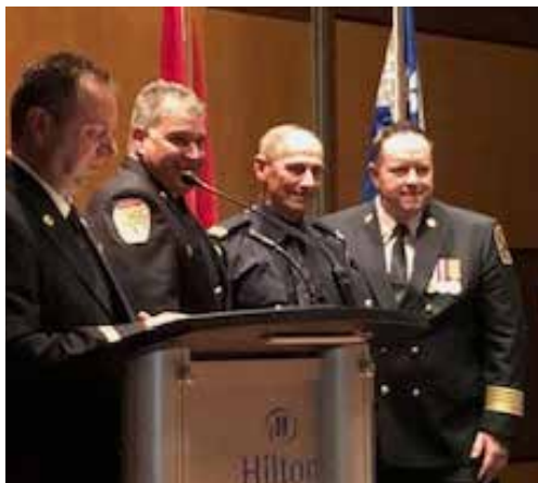
Photo prise lors du Congrès ACSIQ 2024.