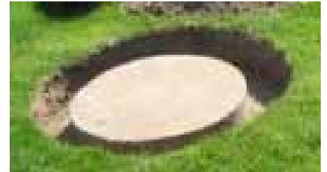
Exemple d'un couvercle bien dégagé

De plus, votre numéro civique doit être lisible de la voie publique pour éviter les erreurs.