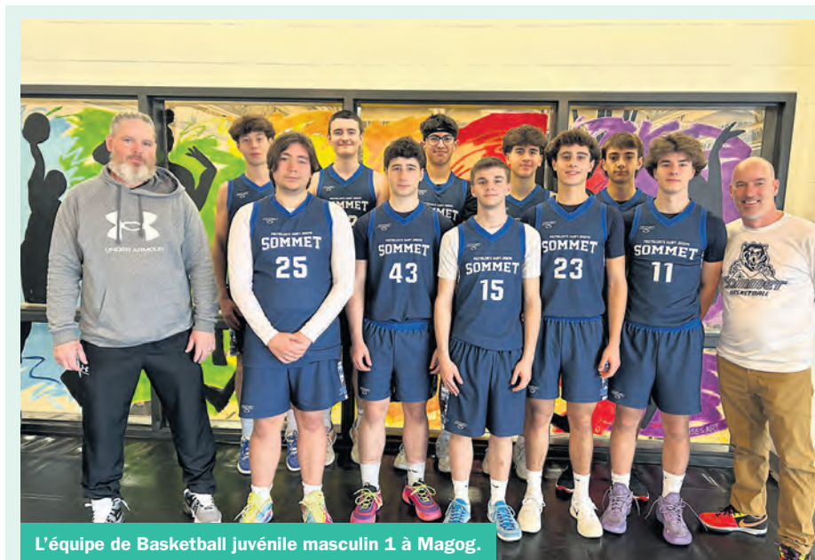
L'équipe de Basketball juvénile masculin 1 à Magog.