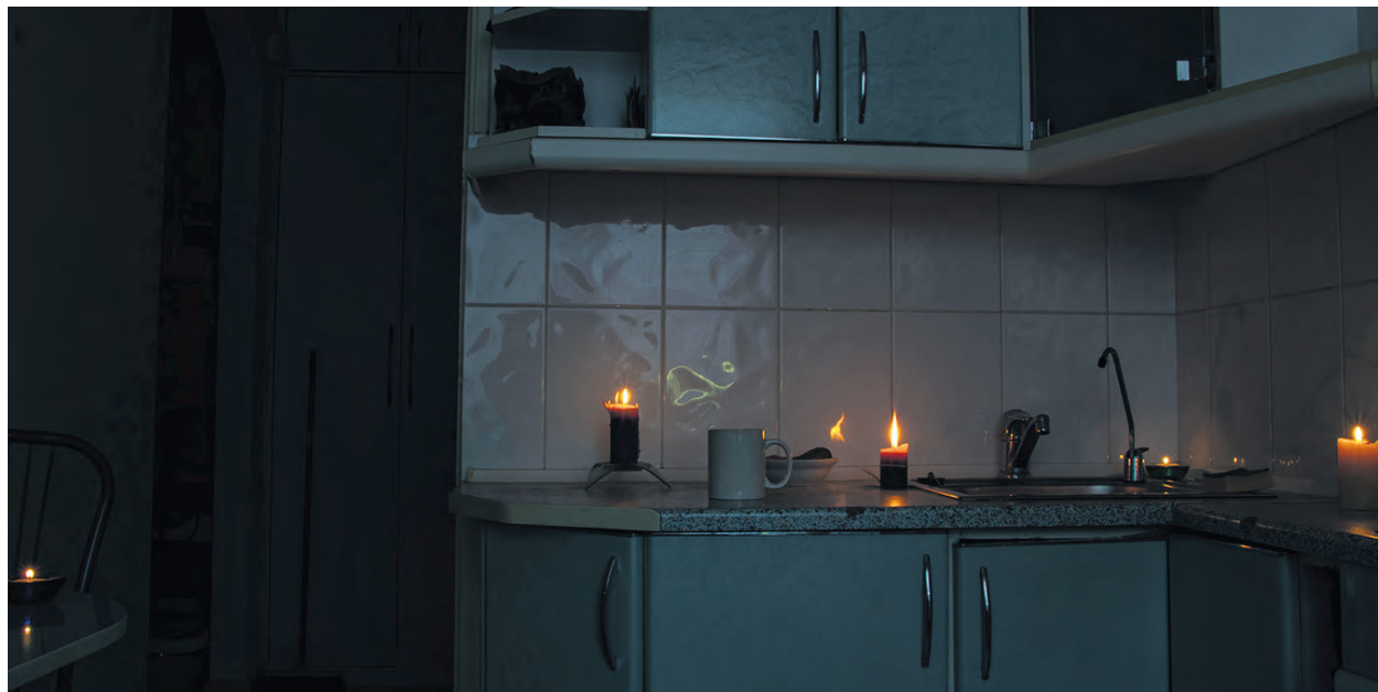
Pendant une douzaine d'heures, plusieurs résidents de Labelle comme de La Minerve ont été plongés dans le froid et, en soirée, dans la noirceur.

Le 9 décembre, la société d'État québécoise a mobilisé plus de 125 camions pour effectuer des travaux de remplacement de poteaux sur 15 kilomètres de son réseau, en plus de revoir son réseau de fils. L'interruption de courant a commencé vers 8h15, plongeant instantanément des centaines de foyers dans le froid et dans le noir. Ces travaux, qui avaient été annoncés comme d'une durée de huit heures, auront finalement pris fin vers 22h30. « Quand j'ai appris la nouvelle (...), j'ai appelé Hydro-Québec le lendemain, leur disant que c'était inhumain de couper le courant, surtout pour des gens en situation de vulnérabilité. Mais rien à faire, les travaux auraient lieu le 9 décembre. Puis, en plus, il y a eu quatre reports de fin de travaux en fin de journée », s'indigne l'élue.