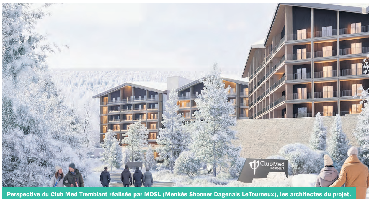
Perspective du Club Med Tremblant réalisée par MDSL (Menkès Shooner Dagenais LeTourneux), les architectes du projet.