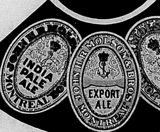
(étiquette blanche) (étiquette dorée) (étiquette bleue)

Pour apprécier les propriétés rafraîchissantes de la bière au summum de la perfection, versez-vous un verre de Molson. Vous aimerez sa pétillante saveur, sa moelleuse consistance, et il en sera de même pour vos amis. Fabriquées conformément à des traditions vieilles de plus d'un siècle, les trois fameuses Bières Molson symbolisent l'hospitalité dans des milliers de foyers.