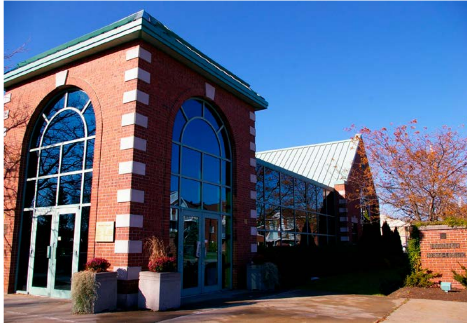
Un club de lecture pour les adolescents est offert à la bibliothèque Roland-LeBlanc.

Les activités sportives sont nombreuses, et les populaires cours de planche à roulettes reprendront le 5 mai prochain pour une période de cinq semaines, soit jusqu'au 12 juin. Cette activité est destinée aux personnes qui désirent apprendre à faire de la planche à roulettes à en parfaire leur technique. Deux niveaux sont offerts. Les en-