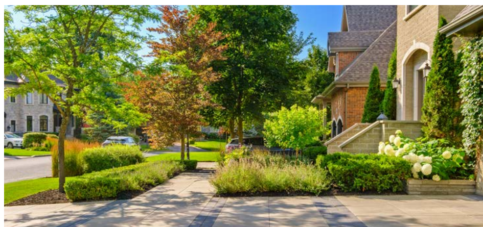
Leur projet à Carignan a décroché la deuxième place dans la catégorie « Des façades invitées, 50 000 $ et plus ».