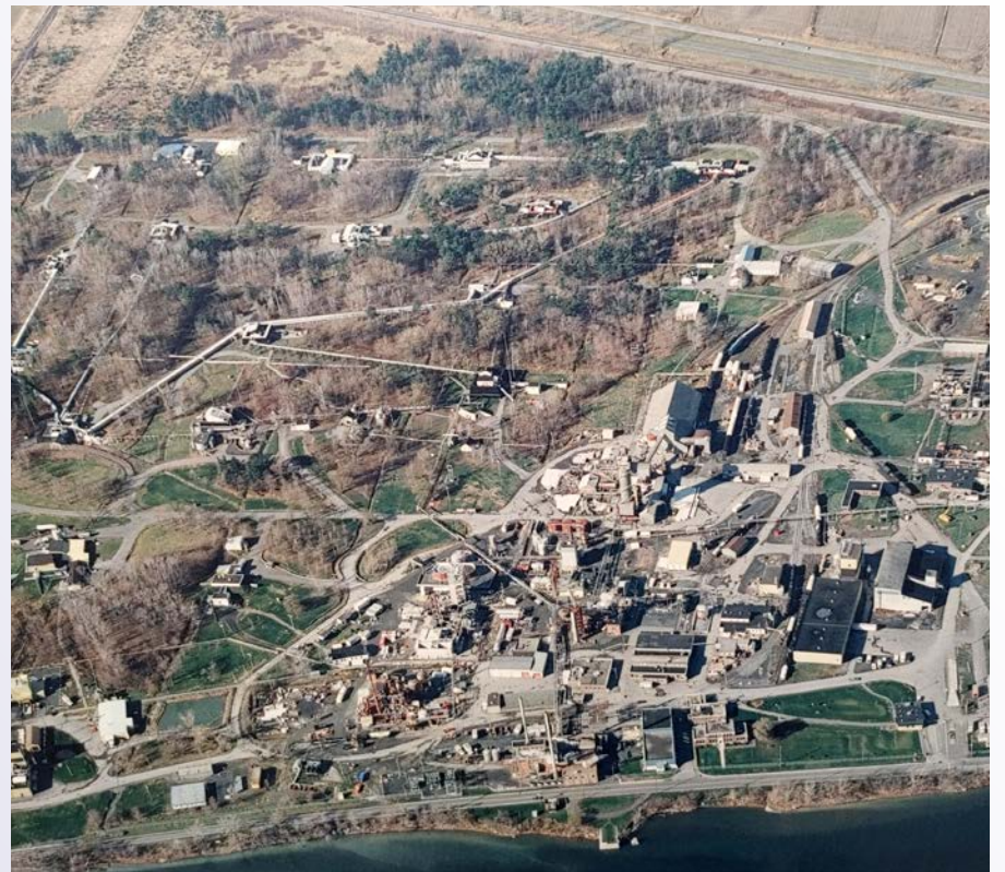
Les installations de la CIL à McMasterville et à Saint-Basile-le-Grand.

Le territoire visé par la demande d'annexion est vaste, s'étendant des limites de McMasterville jusqu'au lot 12 du cadastre de Saint-Joseph-de-Chambly inclusivement, soit jusqu'à la ligne de transport électrique qui passe à proximité du 31, chemin du Richelieu. Il est bordé par la rivière Richelieu au sud et par le boulevard Sir-Wilfrid-Laurier au nord, incluant également quelques ter-