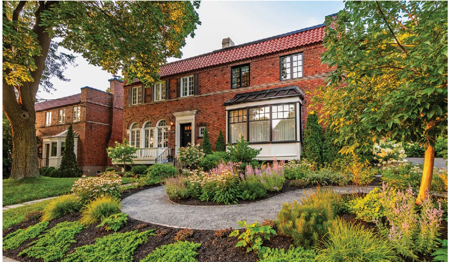
Situé au cœur de Montréal, le projet a remporté le premier prix dans les catégories « Jardins d'ombre et de lumière » et « Le tour de la maison, moins de 250 000 $ ».

L'entreprise a été récompensée cette année, non seulement pour ses réalisations, mais