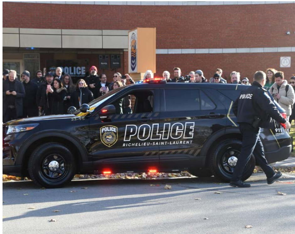
La Régie intermunicipale de police RSL reçoit une aide financière de Québec.

Cette somme servira à démarrer un projet de pratiques mixtes et ainsi assurer la sécurité des Québécois dans la circonscription de Chambly. Un geste important pour permettre aux policiers de mieux intervenir auprès de ces personnes vulnérables. Cette aide financière permettra à la Régie intermunicipale de police Richelieu-Saint-Laurent de tester une approche novatrice dans sa