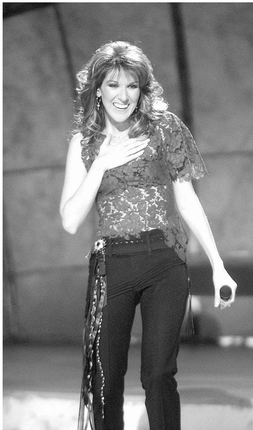
Céline Dion est émue par l'accueil qui lui est réservé après la chanson d'ouverture de son concert, dimanche, au Kodak Theatre.