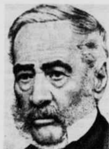
P. Aubert de Gaspé