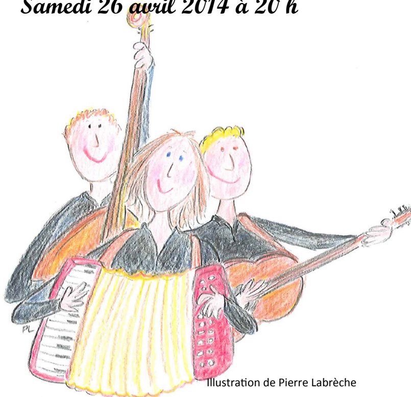
Illustration de Pierre Labrèche