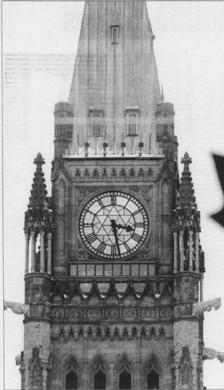
Le résultat des élections fédérales aura un effet important à la fois au Québec et en Ontario. Les enjeux fédéraux ne seront pas non plus totalement absents des élections qui auront lieu dans les autres provinces canadiennes en 2007.