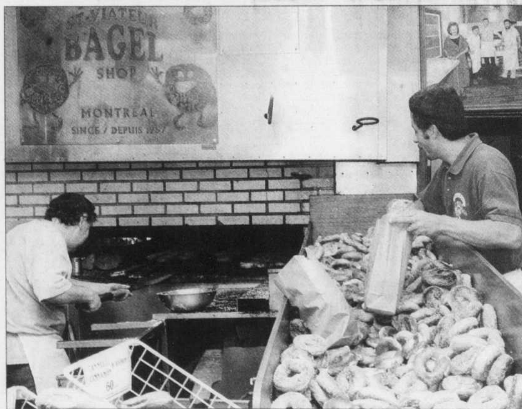
Saint-Viateur Bagel a été créé en 1957.

Au fil des ans, les deux boulangeries du quartier Mile-End ont joué un rôle économique et social im-