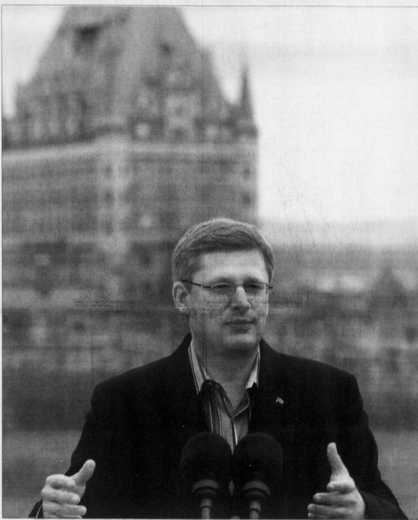
Le 23 juin dernier, Stephen Harper est venu souhaiter une «joyeuse Saint-Jean» aux Québécois devant la citadelle.