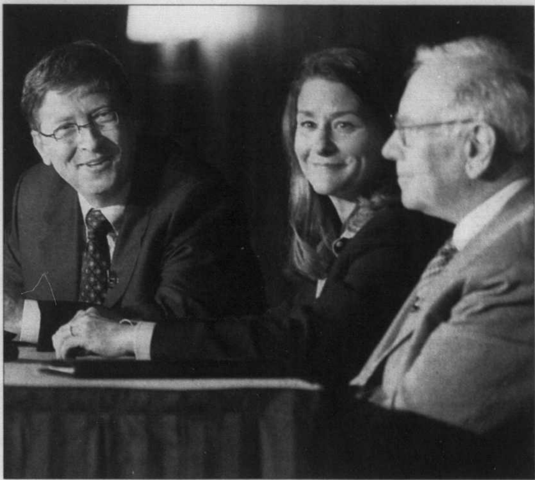
Bill Gates (à gauche en compagnie de sa femme) vient de promettre plus de 30 milliards pour soulager une part des innombrables maux du monde. Le milliardaire Warren E. Buffet (à droite) en a ajouté autant.

Le dernier chic philanthropique à l'ère de la mondialisation se transpose des causes localisées (les musées, les hôpitaux, etc.) à l'humanitaire globalisé. La Bill and Melinda Gates Foundation vient en aide aux sidéens et aux tuberculeux d'Afrique et d'Asie. Richard Branson, un autre nabab généreux, promet