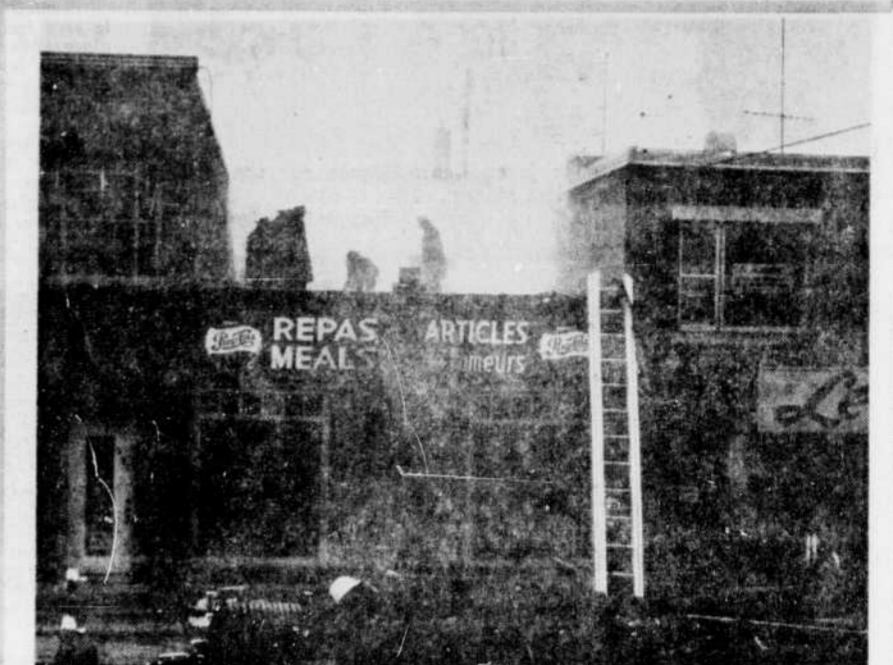
PAR LE TOIT. — La fumée était si dense, à l'intérieur du restaurant Donat Rheault que les sapeurs se sont vus dans l'obligation de perforer la toiture de la bâtisse, pour y lancer les jets d'eau. Sur la photo, un groupe de sapeurs sur la toiture de l'établissement.

Propriété 2 logements, située dans le quartier St-Pierre. Libre les mai. Très bon revenu et parfaite condition. Tél. 472-8811. Drummondville, entre 38. et 39. p.m.