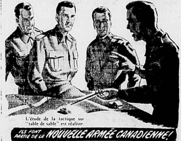
L'étude de la tactique sur "table de sable" est réaliste.

Riches de santé Ils sont en santé, nos soldats! Ils ont passé un examen quand ils se sont enrôlés, et ils DEMEURENT en santé. Ils sont bien nourris, habillés, font de la culture physique sous la conduite d'experts... participent à des récréations variées... et, en tout temps, on leur procure gratuitement des soins médicaux et dentaires.