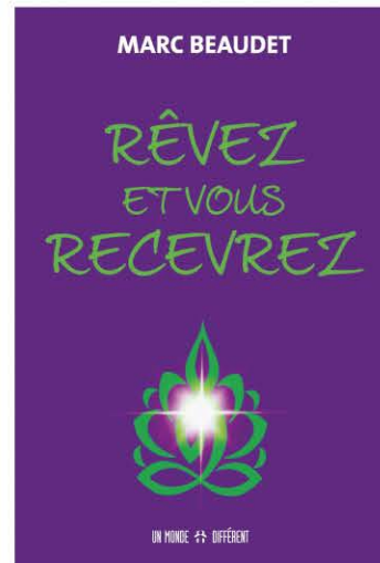
Le Varennois a lancé la semaine dernière son deuxième livre « Rêvez et vous recevrez », comment visualiser et atteindre ses rêves.

Son ouvrage s'adresse donc à tous ceux et celles qui chérissent un ou des rêves, « mais qui ne savent pas par où commencer! », ajoute celui qui s'est donné comme mission d'éveiller les gens à la conquête de leurs propres rêves.