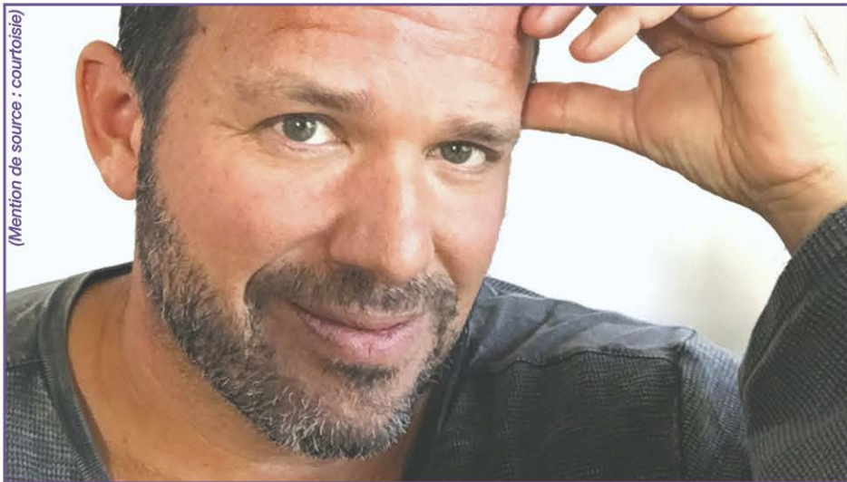
Marc Beudet a été le caricaturiste du Journal de Montréal de 2002 à 2015, où il a remporté plusieurs distinctions, dont celle du meilleur caricaturiste au pays au prestigieux Concours canadien de journalisme (2006 et 2011).