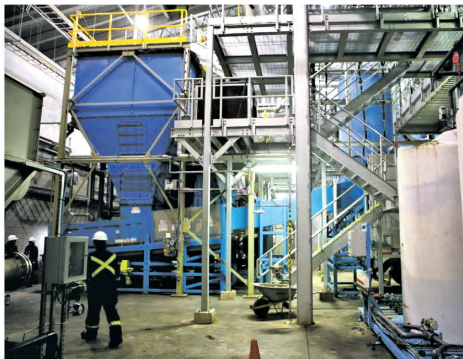
Remplacer les deux tiers du gaz naturel de source fossile par du biogaz permettrait d'éliminer 7,2 millions de tonnes de gaz à effet de serre annuellement, soit l'équivalent de 1,5 million de voitures sur les routes.

production d'énergie renouvelable génératrice d'emplois de qualité en région », a mentionné pour sa part la présidente et chef de la direction d'Énergir, Sophie Brochu.