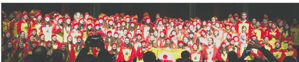
La délégation de la Rive-Sud

En plus de passer près de six heures par semaine avec son équipe AA, elle est inscrite au programme Sport-études en ringuette, ce qui lui permet de bénéficier d'un entraînement quotidien supplémentaire. Élodie est une joueuse agréable à