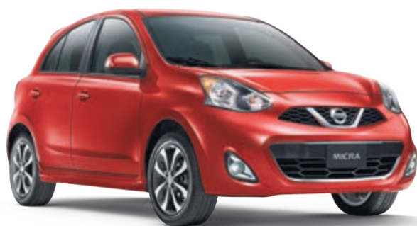
Micra SR illustrée*

LOCATION COURTE DURÉE - PAIEMENTS AVANTAGEUX