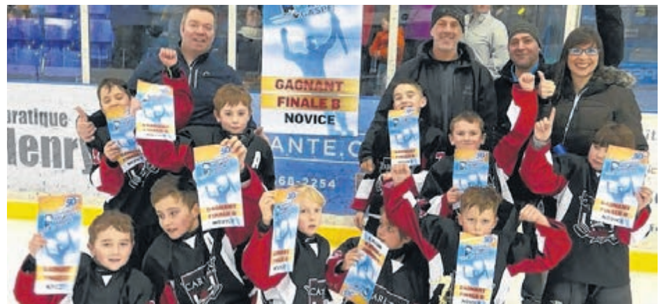
Les gagnants de la finale B novice: les Conquérants Carleton-sur-Mer.