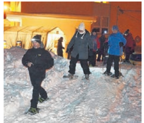
La course de raquettes a connu passablement de succès à ce carnaval qui a remporté encore cette année un très grand succès.

Le comité du Carnaval d'hiver de Nouvelle aimerait particulièrement remercier tous les bénévoles ayant participé à cette 6 e édition sans qui l'événement aurait été impossible à réaliser et bien sûr, la population de Nouvelle et des environs pour avoir participé à notre événement. À l'année prochaine. (A.L.)