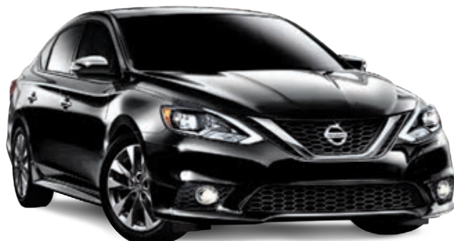
Sentra Turbo illustrée*