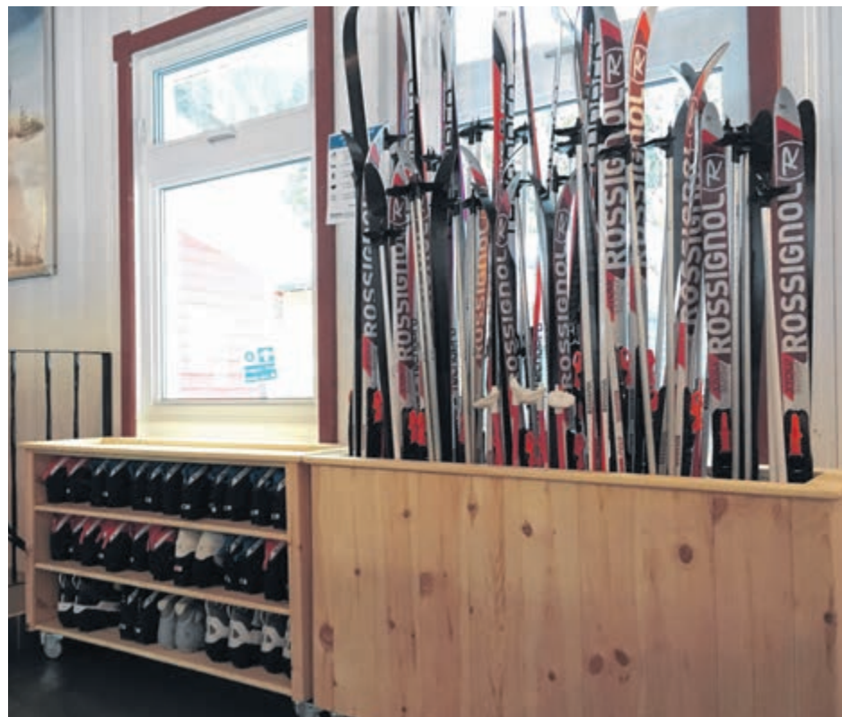
Depuis le 17 février, les enfants et adultes d'ici et d'ailleurs peuvent emprunter gratuitement des équipements pour skier dans les sentiers forestiers.

familiale et de la politique Ville étudiante adoptées respectivement en 2012 et en 2016. (A.L.)