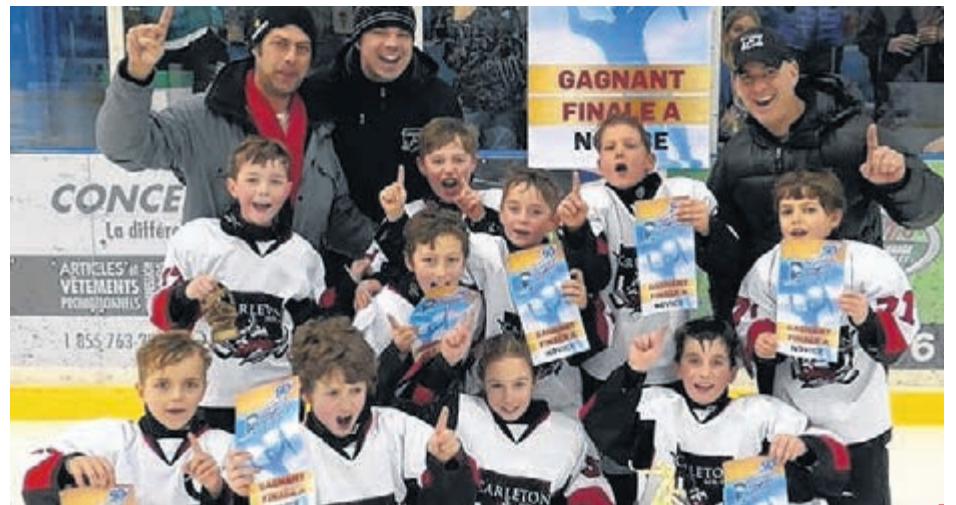
Les gagnants de la finale A novice: les Vikings Carleton-sur-Mer.