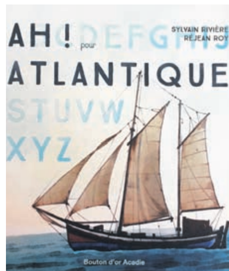
Voici un autre abécédaire à placer sous la plume de Sylvain Rivière Ah ! Atlantique .

Il y a aussi Le Tour du jardin publié dans le cadre des célébrations du 250 e de