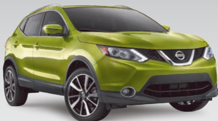
Qashqai SL Platine illustré*