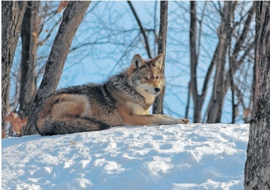
Un spécialiste des prédateurs viendra renseigner les chasseurs gaspésiens sur ce type de chasse qui devient de plus en plus populaire.

La participation à cette activité est gratuite et il n'est pas nécessaire de vous inscrire. La chasse aux prédateurs est en plein développement. Il est temps pour les chasseurs de la Gaspésie de découvrir cette activité des plus passionnantes. (A.L.)