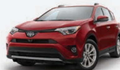
Modèle XLE Premium 2018 illustré