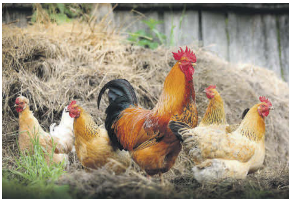
La Ville d'Acton Vale vient de lancer un projet pilote qui permet l'élevage de poules en milieu urbain.

Pour en savoir plus sur le projet pilote : https://ville.actonvale.qc.ca/services/services-municipaux/urbanisme,section « Poules en milieu urbain ».