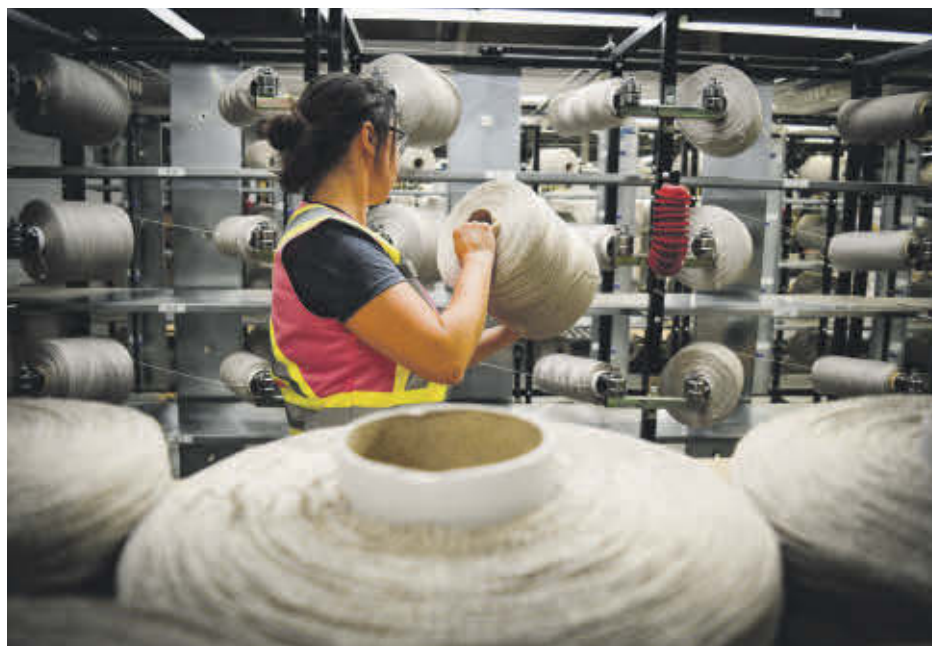
Les employés de Beaulieu Canada ont refusé les termes d'un nouveau contrat de travail dans une proportion de 71 %.