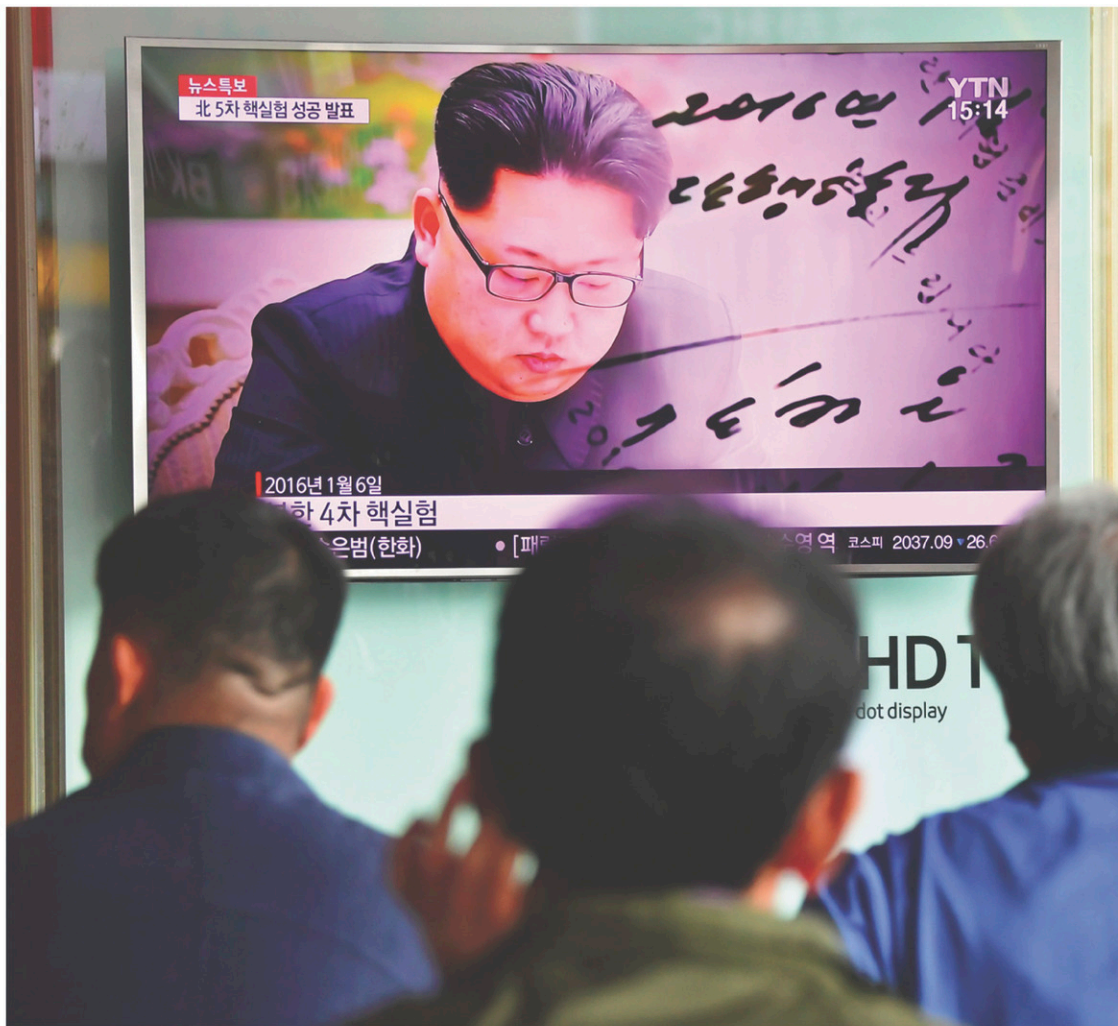
Des Nord-Coréens regardent les actualités montrant le leader coréen, Kim Jong-un, dans une gare de Séoul, à la suite de son nouvel essai nucléaire, le 9 septembre.

Oui, et ces négociations peuvent même être plus fructueuses ! Kim Jong-un a toujours fait de l'économie sa priorité. Contrairement à son père, il a promis au peuple que celui-ci n'aurait plus à se serrer la ceinture. Si la communauté internationale s'allie pour négocier selon ses termes, je pense qu'il se montrera plus coopératif que son père. L'idée serait de lui proposer une aide au développement économique auquel il as-