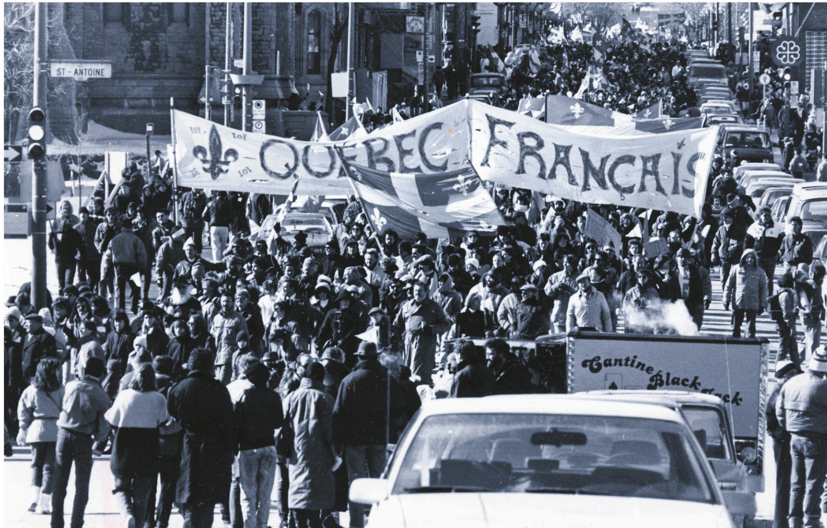
CHANTAL KEYSER LE DEVOIR

Avec l'adoption en 1975 de la Charte québécoise des droits et libertés, le Québec s'inscrivait, à sa façon, dans le mouvement universel en faveur des droits de l'homme. Toutefois, en 1982, l'entrée en vigueur de la Charte canadienne, malgré l'opposition du Québec, bouleversait le paysage. Dorénavant, les droits fondamentaux allaient trouver leur source dans un document enchâssé dans la Constitution canadienne, applicable en principe uniformément d'un océan à l'autre et interprété en dernier appel par les juges de la Cour suprême nommés unilatéralement par le pouvoir central. La Charte québécoise des droits perdait alors son autonomie et devenait le relais de l'interprétation donnée aux droits prévus dans le document constitutionnel canadien. Dans une perspective aquinienne, 1982 est l'expression de la volonté de briser le caractère « global » de la culture québécoise, de « déréaliser » et d'« écraser dialectiquement » le Québec. Conséquence de l'entrée en vigueur de la Charte canadienne, celui-ci ne pourrait plus participer par lui-même au mouvement universel en faveur