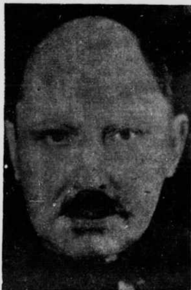
Jean de La Varende

L'action se déroule dans un pays où les Juifs sont frappés d'ostracisme. Une lettre reçue d'une Juive, ancienne maîtresse du héros de Werfel, semble annoncer qu'un fils est né de leur adultère. Le fait s'avère d'autant plus lourd de conséquence qu'il s'agit d'une demande de protection pour le jeune homme afin qu'il puisse poursuivre ses études. Pour acquiescer à cette demande, le mari, fonctionnaire public,