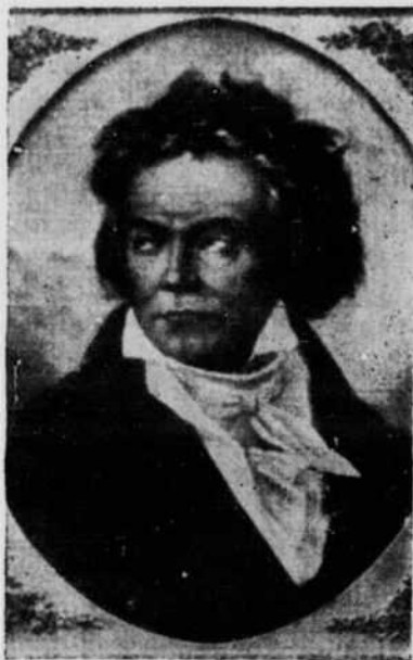
Ludwig von Beethoven Peinture de F. Schimon

mentait très élogieusement cet ouvrage qui oriente tous ceux qu'intéresse la musique vers l'immense production des enregistrements de l'oeuvre beethovénien. Pour qui veut se constituer une discothèque ordonnée, René Girard devient un guide spécialisé précieux qui nous fait mieux connaître le message musical du maître de Bonn.