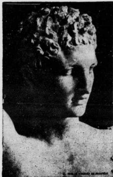
Tête de l'Hermès de Praxitèle

Le rapprochement de ces chefs-d'oeuvre, témoins de deux époques de haute culture, atteste l'incontestable supériorité de l'art chrétien. La noblesse spirituelle et la saine vigueur du marbre michélangesque l'emportent sur la beauté molle et presque efféminée de l'antique.