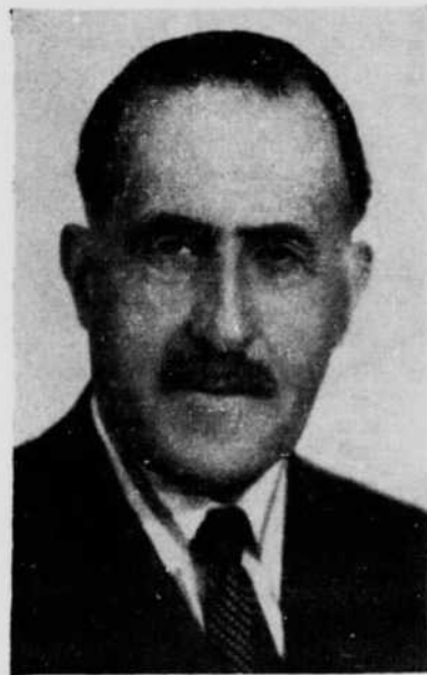
Serge de Fleury

L'ouvrage de Serge de Fleury se compose en majeure partie d'apophtegmes, de sentences et de maximes comme il était de mode d'en écrire au XVIIIe ou au XIXe siècle, mais l'auteur ne possède pas la plume incisive et caricaturale de La Bruyère. Ce sont tout au plus d'heureux coups de crayon, des sentences parfois un peu trop absolues, jamais franchement méchantes et toujours propres à faire réfléchir.