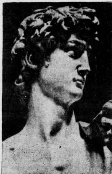
Tête du David de Michel-Ange