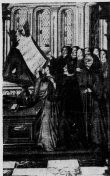
Miniature d'un manuscrit français