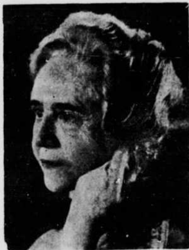
Gertrude von Le Fort

Odes de Claudel et à l' Offrande lyrique de Tagore. L'âme féminine s'y trahit à une certaine faiblesse des moyens et à une certaine précarité de l'inspiration. Les dons poétiques de Gertrude von Le Fort se révèlent parfois impuissants à étreindre leur objet, incapables de se hausser au niveau du sublime.