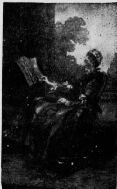
Madame d'Epinau par Carmontelle (1760)

Ce roman, bien construit, écrit avec beaucoup d'humour et de sensibilité, campe des personnages très attachants. D'amusantes caricatures de mauvaises langues y sont exactement tracées. Un récit plein d'intérêt, un roman de la province alerte, dru, malicieux, plein de charme.