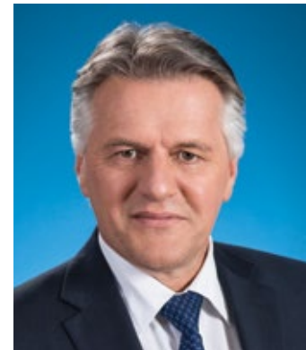
Le ministre de l'Agriculture, des Pêcheries et de l'Alimentation

Se procurer des poissons et des fruits de mer du Québec, c'est contribuer à l'économie de nos régions côtières et au maintien de quelque 8000 emplois. Excellente saison à toutes et à tous.