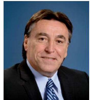
L'adjoint parlementaire du ministre de l'Agriculture, des Pêcheries et de l'Alimentation