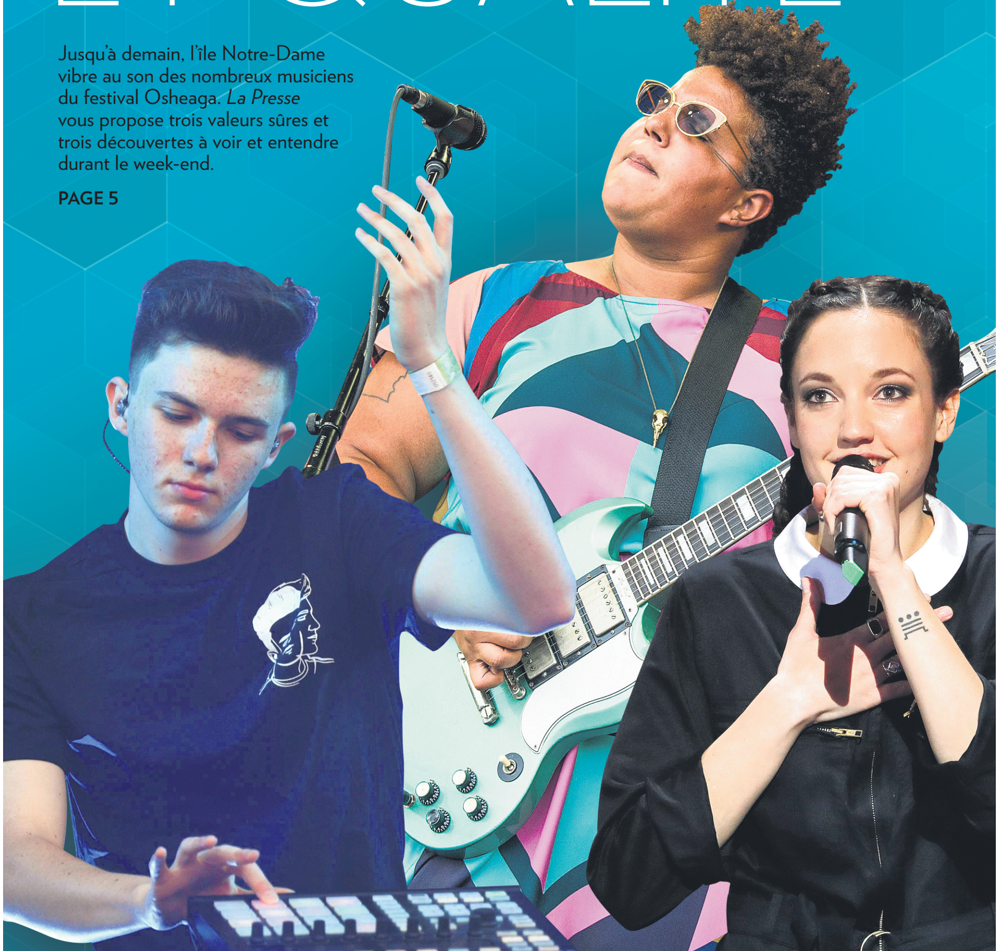
PHOTOMONTAGE LA PRESSE