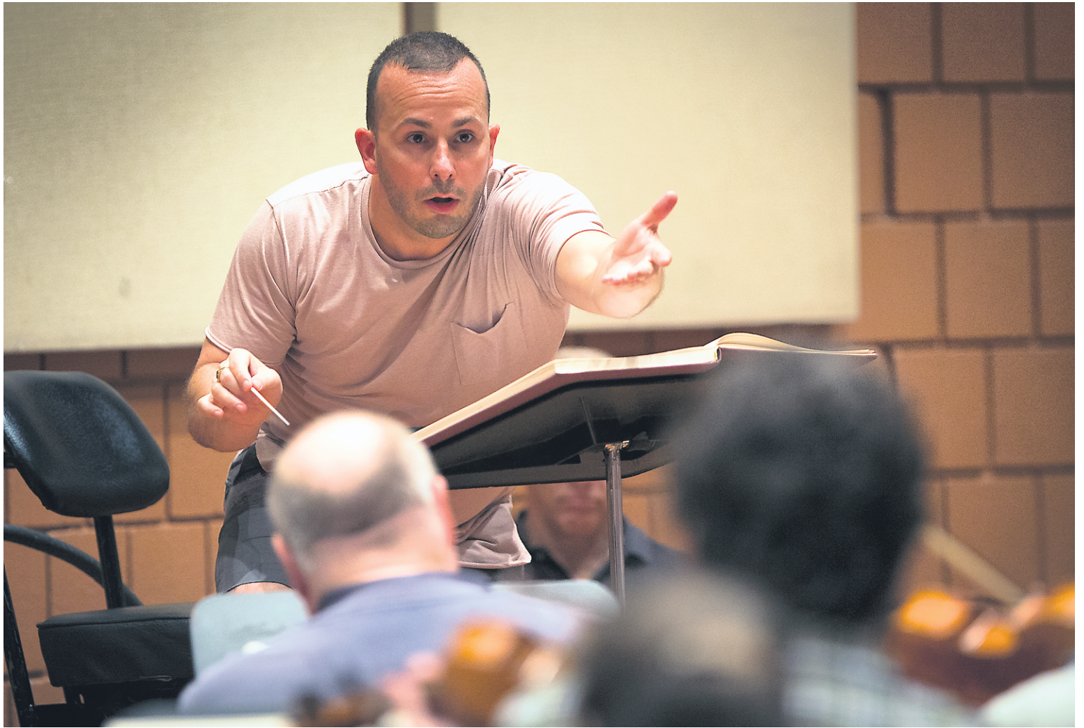
Yannick Nézet-Séguin en répétition avec les musiciens de l'Orchestre Métropolitain.

L'exécution de Parsifal repose plus précisément sur 89 instrumentistes de