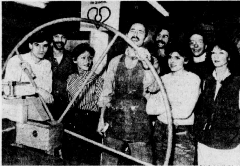
A l'ARG, tous sont prêts à accueillir le grand public lors de leur 5e encan en art contemporain.