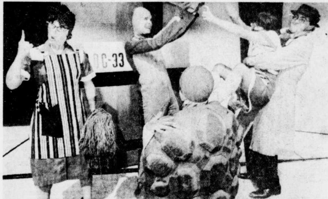
Sabotage au Bloc 33: folie collective au ministère de la Planification...