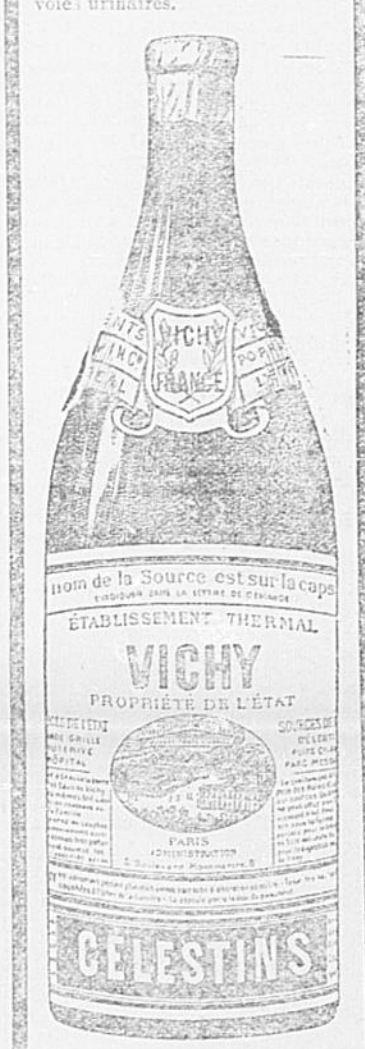
Mettez-vous des imitations.

La dyspepsie la plus rebelle, la gastrite, la gravelle, le diabète, les rhumatismes, la goutte, et toutes les maladies des voies urinaires.