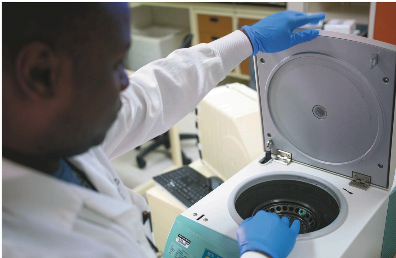
Les laboratoires de Sainte-Justine sont un exemple de précision et de rapidité. Les médecins de l'hôpital pour enfants ont peur que les bénéfices de la recherche pâtissent du transport et des manipulations engendrés par le projet Optilab.