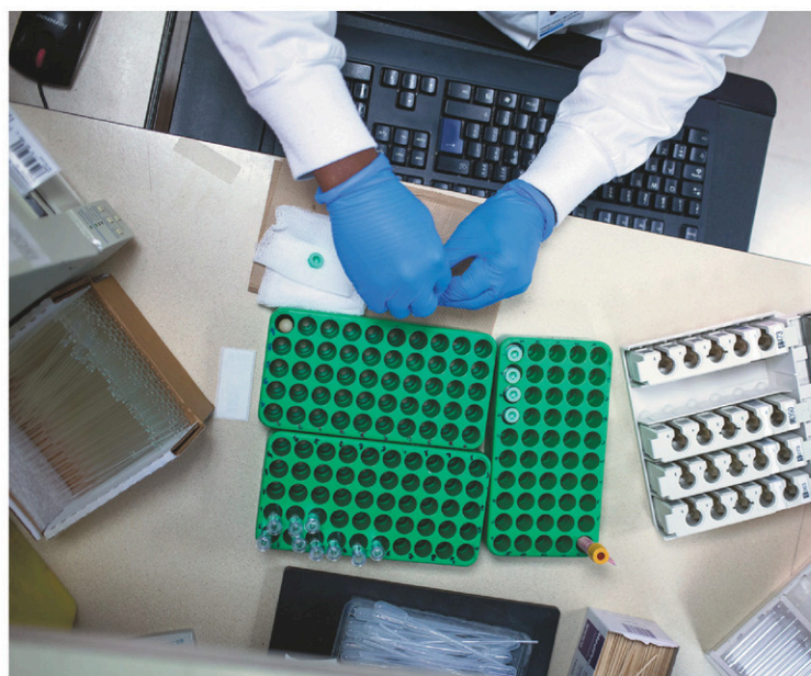
Optilab fait craindre 500 à 1000 pertes d'emplois aux technologues œuvrant en laboratoire.