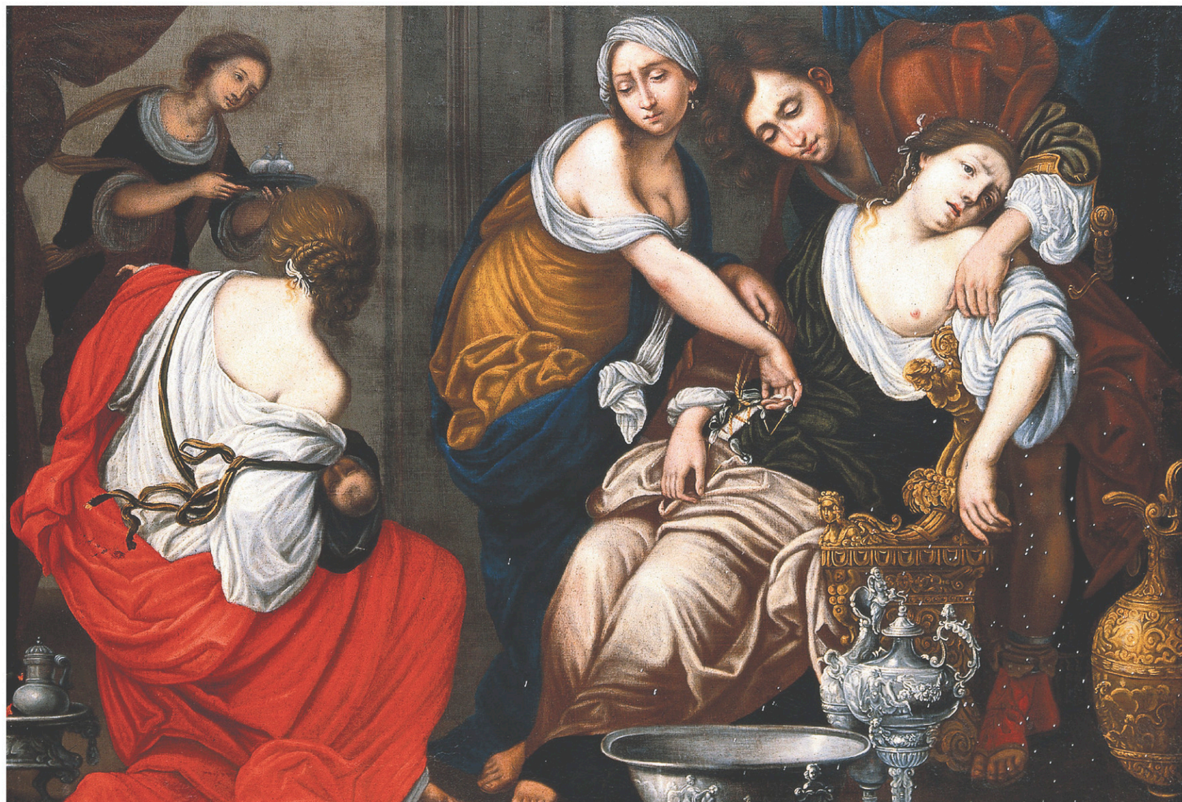
La perception du mal a bien évolué dans le temps, et c'est tant mieux. Alors que la douleur était autrefois perçue comme un mal nécessaire, la résilience à la douleur a été longtemps vue comme une preuve de courage, de maîtrise de soi, même par les médecins, rappelle l'historienne Joanna Bourke. Ci-dessus : l'œuvre La naissance de Benjamin et la mort de Rachel (XVII e siècle) de Francesco Furini.

chroniquefd@ledevoir.com Sur Twitter : @FabienDeglise