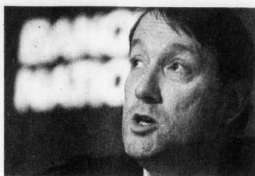
JACQUES NADEAU LE DEVOIR La Banque Nationale, dirigée par Louis Vachon, a terminé son premier trimestre avec un bénéfice net de 69 millions.

Les données ont cependant été amputées par de nouvelles radiations liées aux PCAA. À l'instar