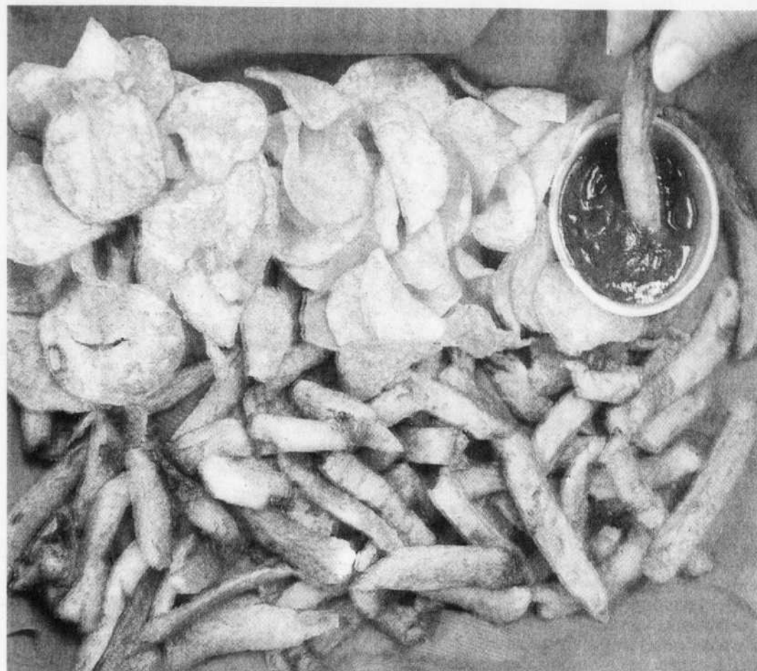
Friands des croustilles et des frites? Il vaudrait mieux limiter votre consommation puisque l'acrylamide qu'elles recèlent est susceptible d'occasionner le cancer.