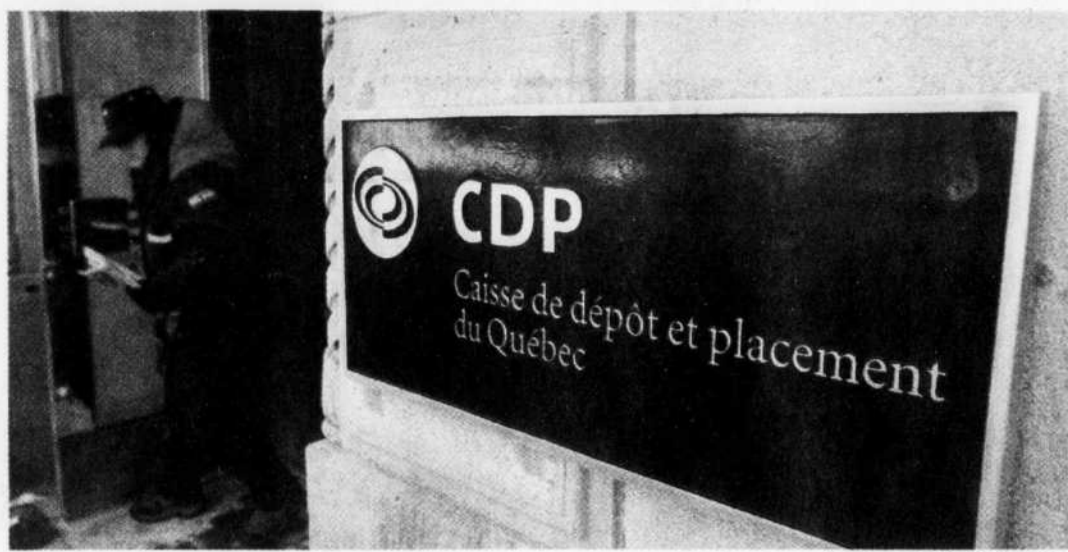
MATHIEU BÉLANGER REUTERS

La CDP a traversé des crises avant aujourd'hui: la crise pétrolière des années 1970, la crise économique au début des années 1980, la crise boursière de 1987, la crise économique au début