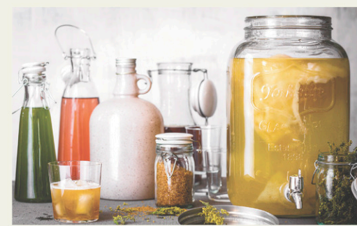
EDITIONS DE L'HOMME