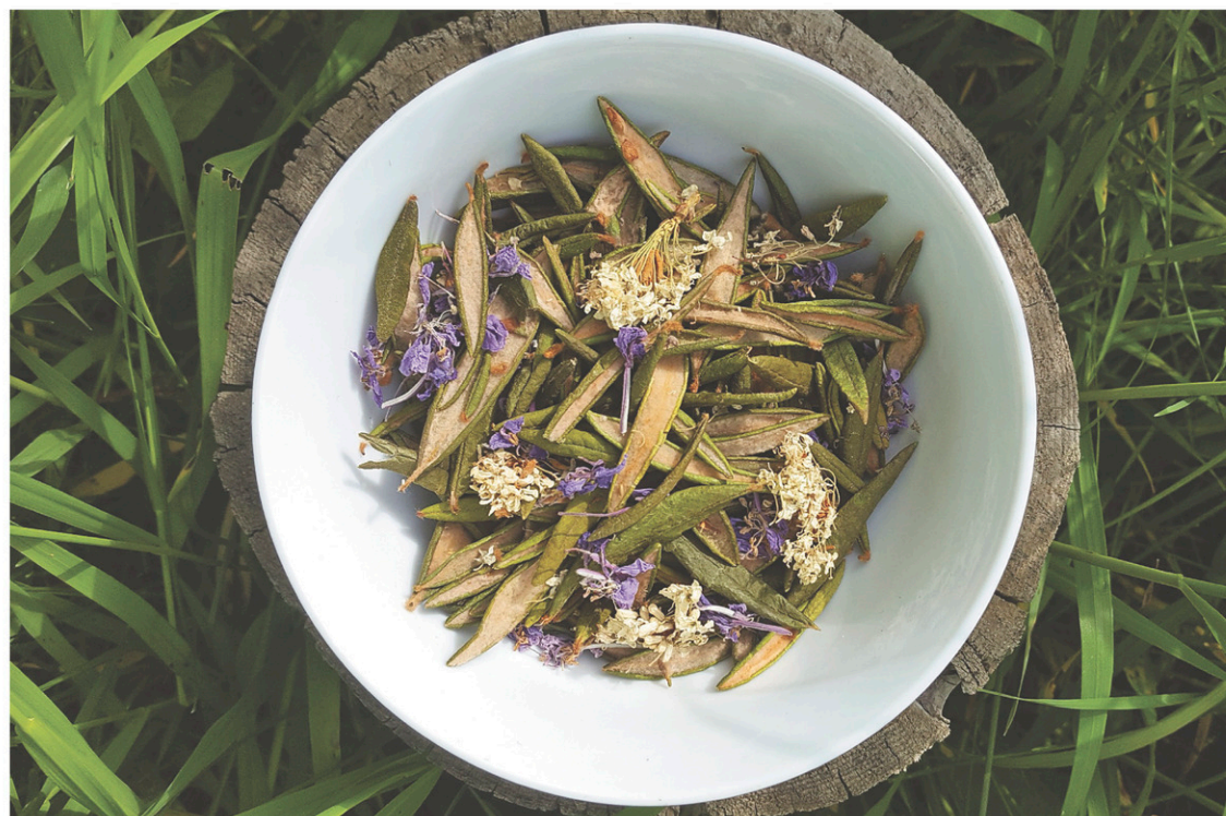
Le mélange Boréale de Forêts et Papilles: thé du Labrador d'été, fleurs de thé du Labrador de printemps et fleur d'épilobe de la forêt boréale québécoise.

Moralité. On cuisine encore peu, voire pas du tout avec les tisanes. Barmans, boulangers, cuisiniers, pâtisseries... Qu'attendez-vous pour vous amuser avec elles? Dans un cocktail, une pâte à pain, en mélange à froter sur une viande ou un poisson, un gâteau... et j'en passe! Comme le thé, la tisane mérite d'être explorée, défrichée en cuisine. Découverte de la tasse.