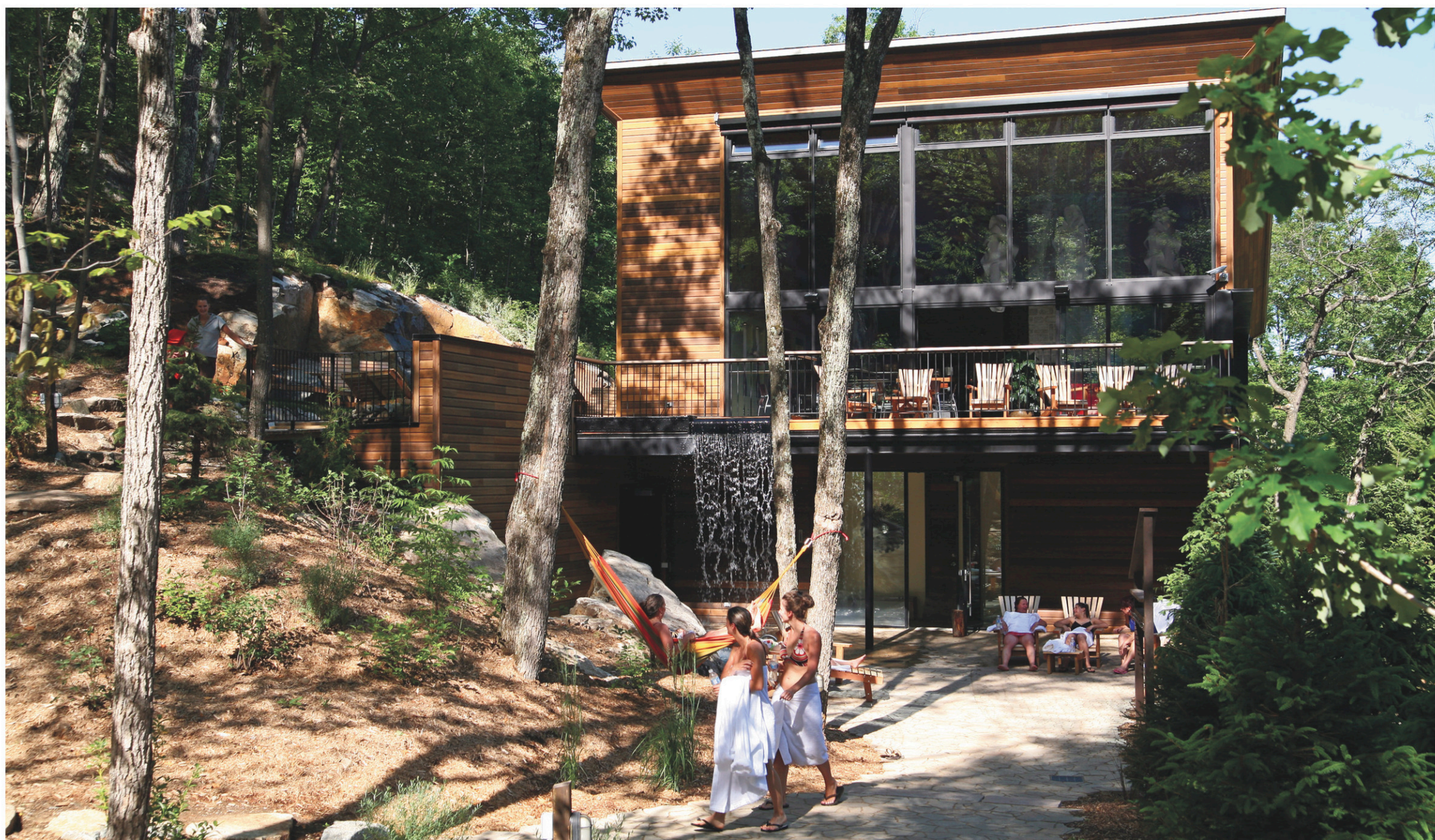
Détente dans le bois à La Source Bains nordiques.