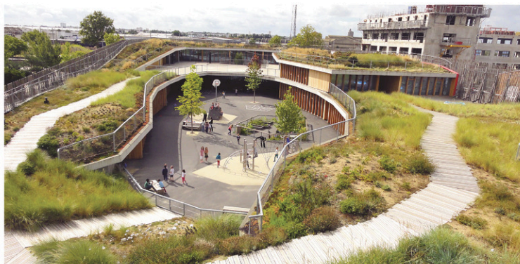
PLANTE &amp; CITÉ

Plante & Cité a fait la recherche pour la réalisation du toit végétalisé de l'école Aimé Césaire à Nantes. Les végétaux utilisés comptent parmi la flore des landes et des dunes de la région.