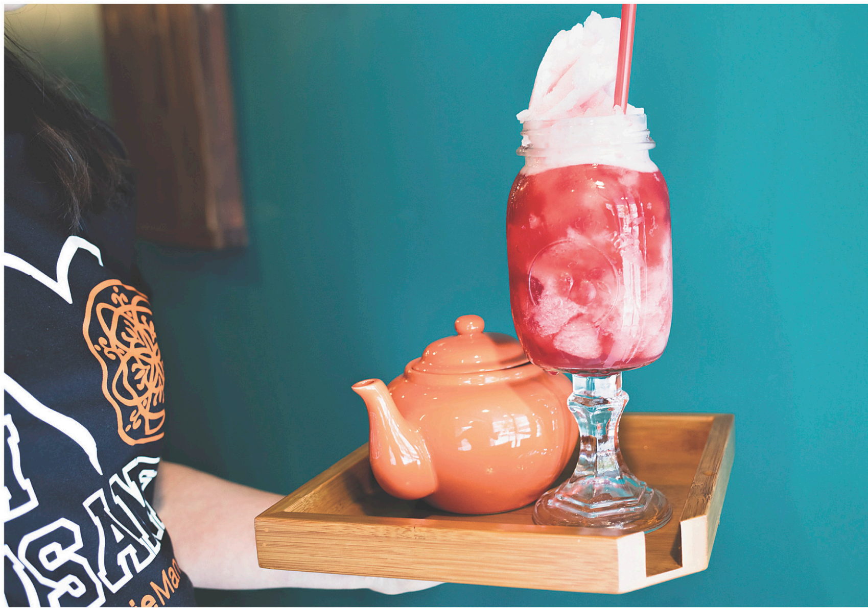
Une tisane glacée de la tisanerie Mandala, une des nombreuses mutations de ce breuvage qu'on peut trouver dans le commerce d'Hochelaga-Maisonneuve.