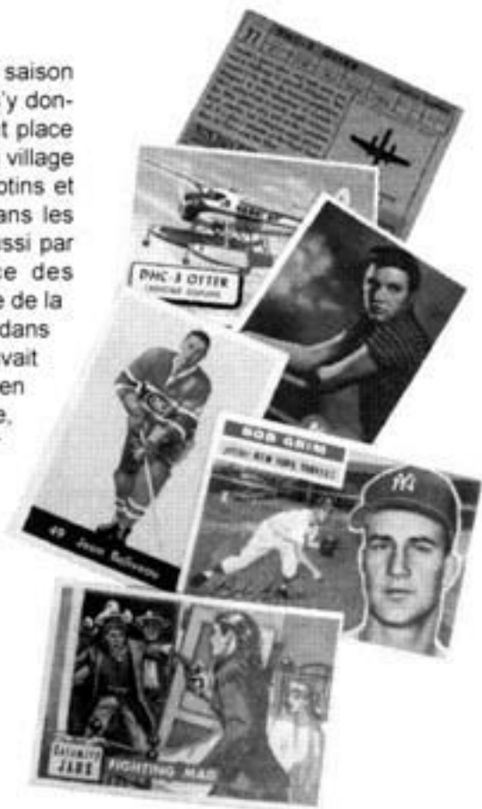
Cartes de collection des années 1950

En 1958, le magasin fut fermé et transformé en appartement pour son fils Jean-Guy nouvellement marié.