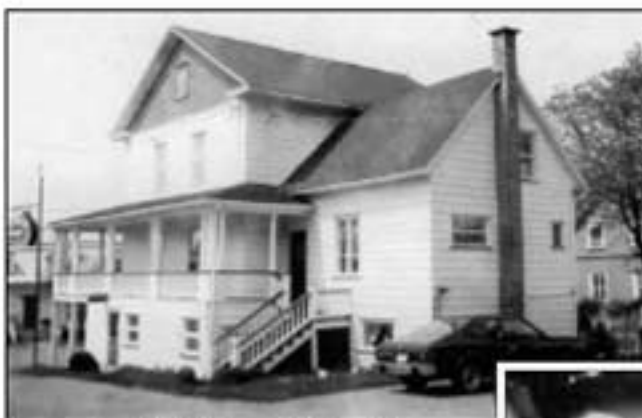
Vue arrière de la bâtisse et de l'entrée de la cuisine du restaurant, vers 1970

La journée commençait tôt dans la cuisine du Café Royal . Madame Gagnon préparait son menu et, à l'heure des repas, elle servait les clients. Pour 3.25$, ils avaient le choix d'une soupe, d'une assiette du jour et d'un bon dessert. Ceux installés au comptoir pouvaient aussi commander un club-sandwich ou un hamburger. Au début, ses cousines venaient lui donner un coup de main en s'occupant des cinq enfants. Quand ses filles, Denise et Gisèle, furent en âge de travailler, elles aidèrent leur mère pour le service et pour le ménage des cabines et des deux motels. À l'hiver, après l'agitation de la saison de vacances, les journées devenaient enfin plus calmes, sauf celles où il y avait une grosse tempête. La route restait alors fermée pour plusieurs jours. Les voyageurs étaient obligés de demeurer sur place. Ces jours-là, la famille revivait l'effervescence de l'été... et madame Gagnon cuisinait tous les plats nécessaires pour nourrir tout ce beau monde.