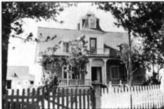
Maison ancestrale de la famille Michaud