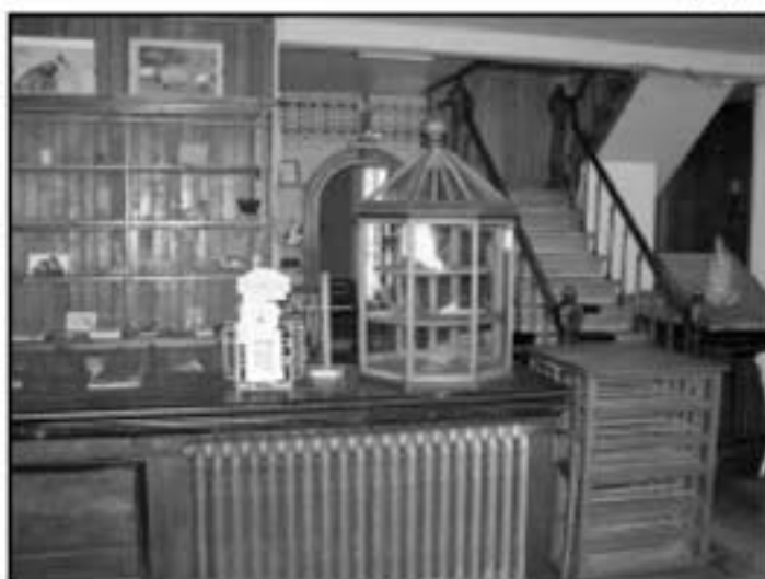
L'intérieur du magasin avec ses comptoirs, en 2009