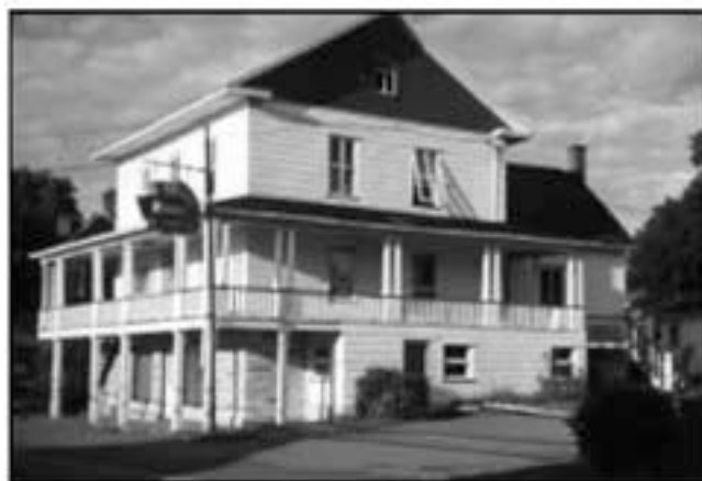
Le commerce avant sa démolition, en 1985