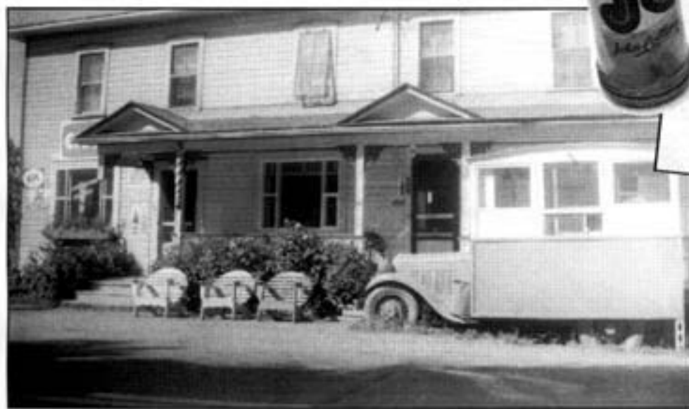
Le Café chez Jos, vers 1960