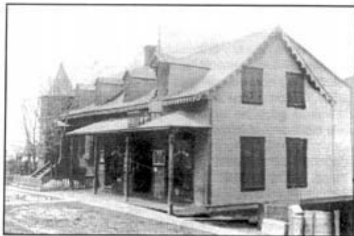
Magasin Sirois vers 1900