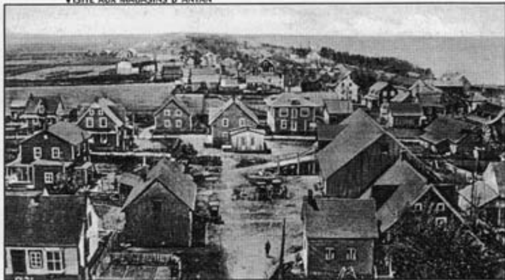
Partie ouest de Cacouna vue du clocher de l'église, vers 1925