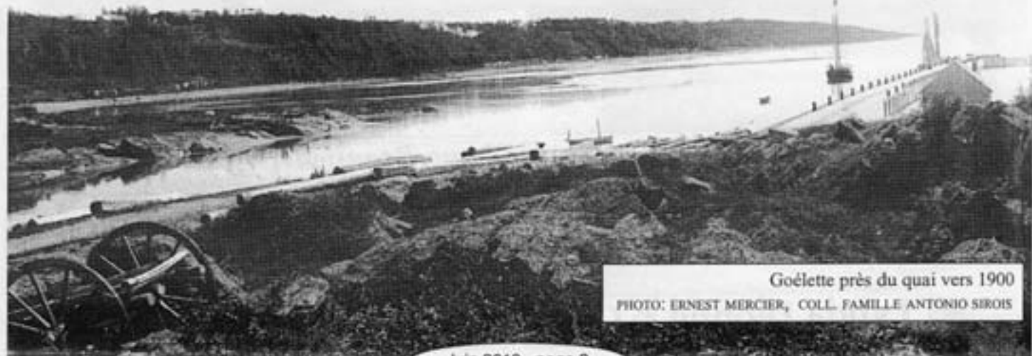
Goélette près du quai vers 1900

Sur la rue principale, de même que dans le Haut et le Bas de Cacouna, plusieurs marchands se succédèrent de père en fils. Des frères s'associaient, d'autres s'établirent à leur compte. De nombreuses épiceries virent le jour et furent gérées par des époux. Les tâches étaient partagées et les femmes s'impliquaient de plus en plus dans les commerces. Même les enfants étaient mis à contribution. À chaque été, les familles d'estivants, provenant surtout de Montréal et de Québec, revenaient fidèlement à Cacouna. Ils achetaient, chez les marchands locaux, des produits de la ferme, mais commandaient aussi certaines denrées de luxe. Les restrictions du temps de la guerre furent difficiles pour tous. Les produits se raréfiaient. Un service de coupons fut mis en place et permit aux commerçants de vendre les denrées rationnées.