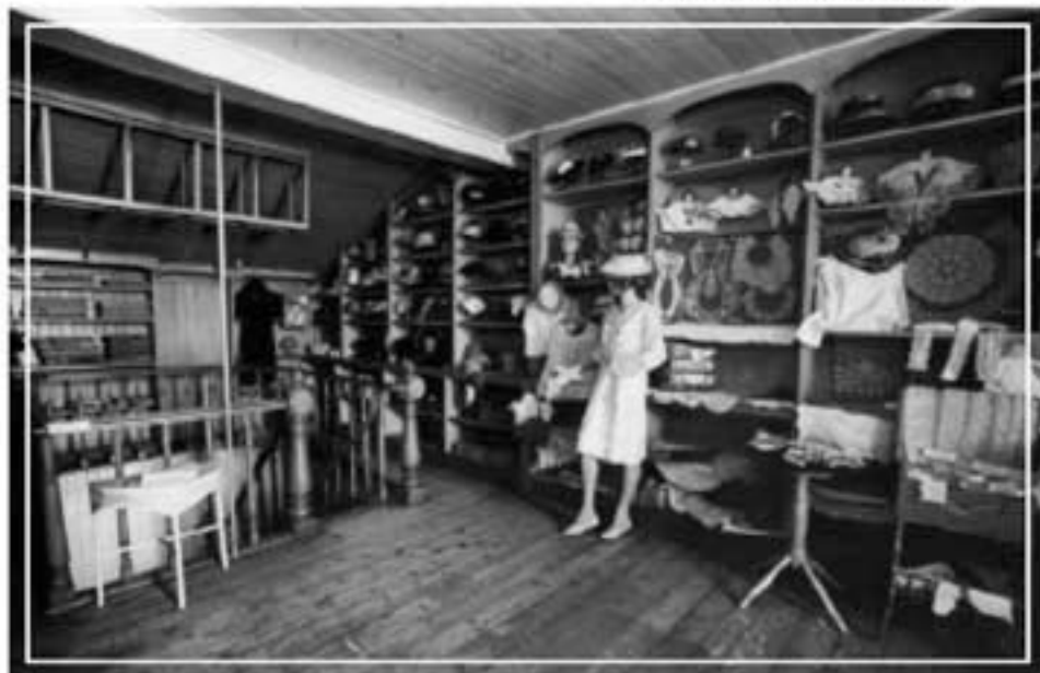
À l'étage, exposition sur le thème de la belle époque présentée lors du lancement du circuit patrimonial, en 1994. Dans cet endroit, au début du 20 e siècle, se vendaient de la lingerie et tout pour la confection