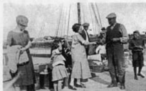
Rassemblement des gens de Cacouna à l'arrivée d'une goélette au quai, vers 1935

Nous vous proposons ainsi de revisiter ces commerces qui étaient au cœur du quotidien des gens de Cacouna, principalement dans la première moitié du 20 e siècle. Ils rappelleront sans doute bien des souvenirs aux plus nostalgiques.