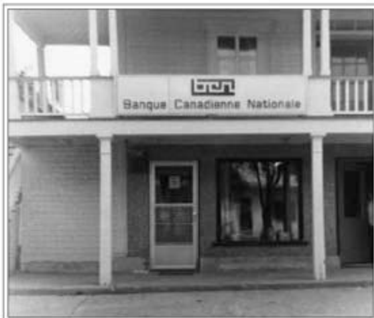
Vue de la façade du restaurant avec, du côté est, la Banque Nationale, en 1970