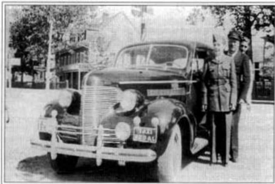
Jos Létourneau, du Taxi Régat , portant fièrement sa casquette de chauffeur

Plusieurs se souviennent encore des patates frites à Mélo, les meilleures à la ronde, diront certains. À la roulotte de monsieur Létourneau, ou plutôt à l'ancienne camionnette Ford Model T des années 1920, on faisait la file les vendredis soir des années 1950-60.