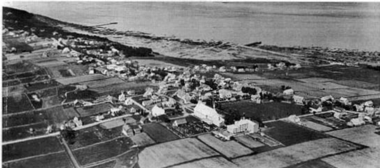
Le village de Cacouna et son quai en 1927