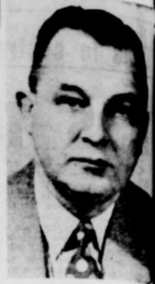
L. PIGEON C.L.U.

NEW-YORK (PA) — Les demandes d'investissement étaient moins nombreuses et le marché des valeurs a connu quelques baisses au cours de transactions modérées hier sur la place de New-York.