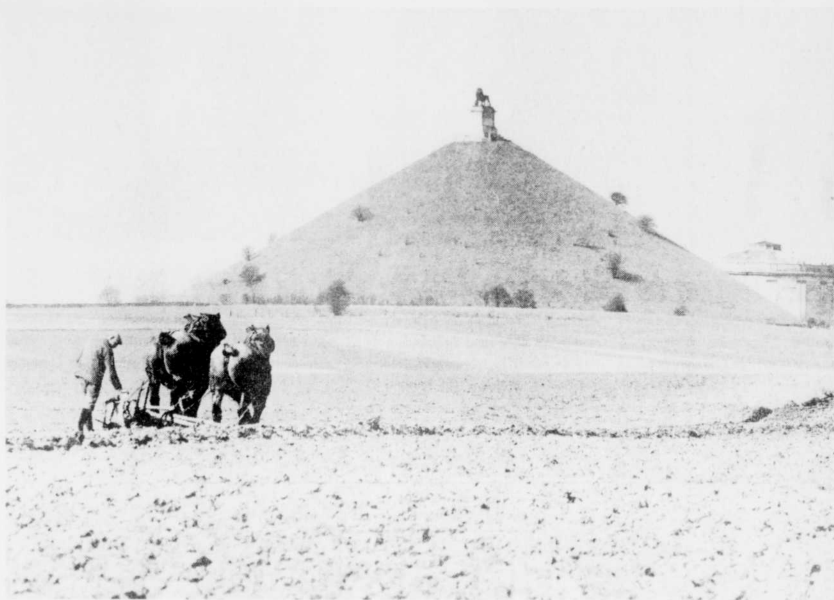
La butte de Waterloo, surmontée de son célèbre lion, est située à 16 milles de Bruxelles, au centre d'une riante plaine agricole.

Waterloo ce plateau funèbre et Ce champ sinistre où Dieu mêla Tremble encore d'avoir vu la solitaire, tant de néants, fuite des géants!"