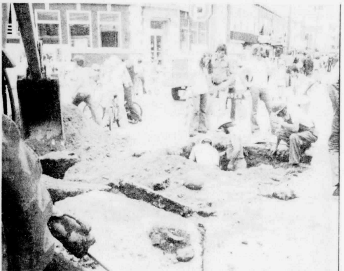
Les nombreux acheteurs qui se sont rendus au centre-ville de Victoriaville ont eu droit hier à un spectacle très imprévu: celui d'employés de la ville de Victoriaville.