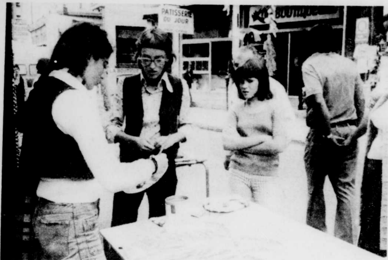
Une mini-rue du trésor avait été installée à Victoriaville lors de la vente-trottoir de deux jours, une expérience des plus nouvelles pour les gens de la région de Victo-