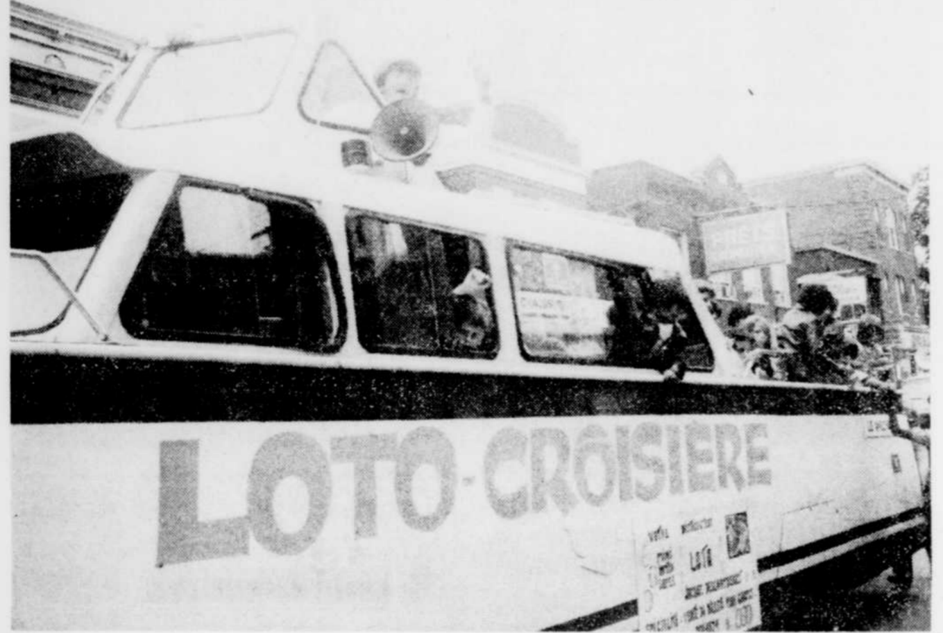
A la vente-trottoir de jeudi et hier, on pouvait voir circuler dans le centre-ville de Victoriaville un navire