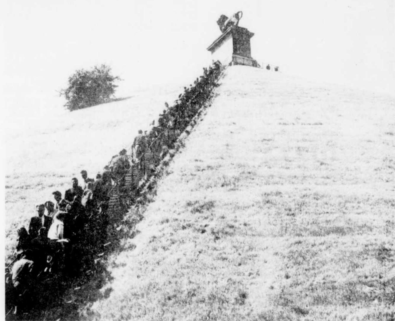
Des milliers de visiteurs escaladent journellement les 226 marches qui conduisent au Lion de Waterloo. En haut, ils essayent d'imaginer la journée fatidique du 15 juin 1815.

Dans une autre pièce est exposé le squelette d'un combattant, dont la dentition parfaite fait présumer du trépas à un fort jeune âge. Au mur est exposé un tableau de la sanglante bataille, tandis qu'au jardin, faisant penser à une petite chapelle, se trouve un ossuaire où sont jetés pêle-mêle des os blancs, seuls vestiges terrestres de ces pauvres humains qui connurent une fin lamentable en ce jour de printemps fatidique de l'an 1815 et pour qui Victor Hu-