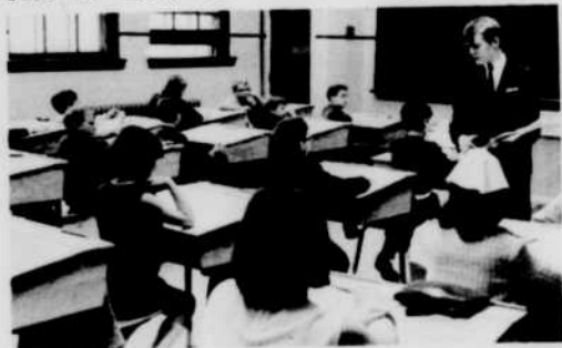
C'est la distribution des questionnaires.

sont présentés au concours écrit pour le choix d'un concurrent. Notre photographe a capté quelques-uns des concurrents en plein travail.