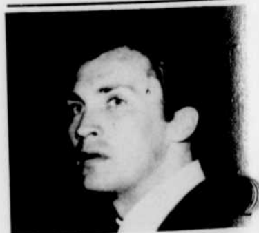
ROY THINNES personnifie le héros de la série «Les Envahisseurs», qui débute le lundi 8 mai à 8 h. 30