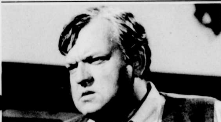
ORSON WELLES sera interviewé à l'émission «Partout», dimanche à 4 heures, au sujet de son film «Falstaff» dont nous verrons quelques images.