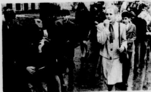
Le concours est terminé et tous espèrent maintenant gagner.

Il y aura un seul élu, mais deux substitués car le héros de Hergé, Tintin, sera le sujet de l'émission TOUS POUR UN pendant trois semaines, même si le concurrent flanche à la première ou à la deuxième étape.