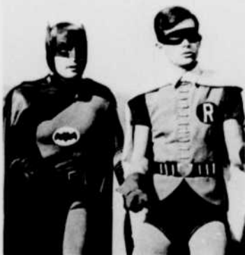
BATMAN (Adam West) et son ami ROBIN (Burt Ward) vivent de passionnantes aventures, chaque mardi à 8 h. 30 du soir, à la télévision.