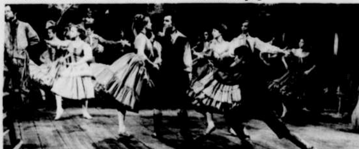
Les deux danseurs étoiles et le Ballet royal de Winnipeg

Rose Latulippe est un spectacle haut en couleur. Décors et costumes sont d'une sobriété de très bon goût. La musique, si moderne soit-elle, ne choque jamais l'oreille et les danses sont réglées avec un art, un humour parfois, une perfection qui ont consacré depuis longtemps la réputation du célèbre Ballet royal de Winnipeg.