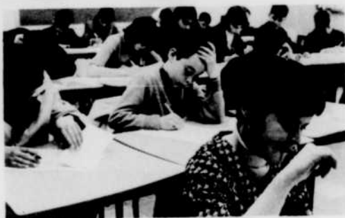
Filles et garçons fouillent leur mémoire.