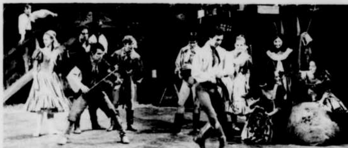
Le Ballet royal de Winnipeg

L'oeuvre a été commandée par la Commission du Centenaire pour la Confédération.