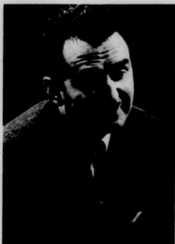
Honorable Jean-Luc Pépin

Nicole Germain et Lise Payette accueilleront à Votre choix , le vendredi 12 mai à 10 h. 15 du soir, à la télévision de Radio-Canada, l'Honorable Jean-Luc Pépin, ministre des Mines et des relevés techniques au fédéral.