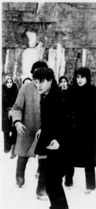
Cinéma canadien mardi 17, 23 h 00