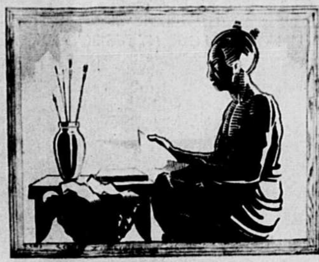
Avant Gutenberg Before Gutenberg

Cette partie de l'exposition de l'imprimerie, à l'Ecole technique, rappelle l'usage de la xylographie, en Chine, avant l'invention de l'imprimerie proprement dite. Les pièces que l'on voit au bas sont des blocs, l'un mongol, le second mandchou, le troisième tibétain. Le tableau du fond a été exécuté par les élèves du cours de publicité de l'école des Beaux-Arts, sous la direction de M. R.-H. Charlebois.