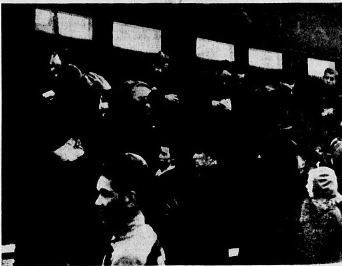
Le régiment écossais de Toronto vient de quitter Montréal, en direction de l'Atlantique, pour aller poursuivre son entraînement avant de s'embarquer pour l'Europe.

Le régiment écossais de Toronto quitte Montréal