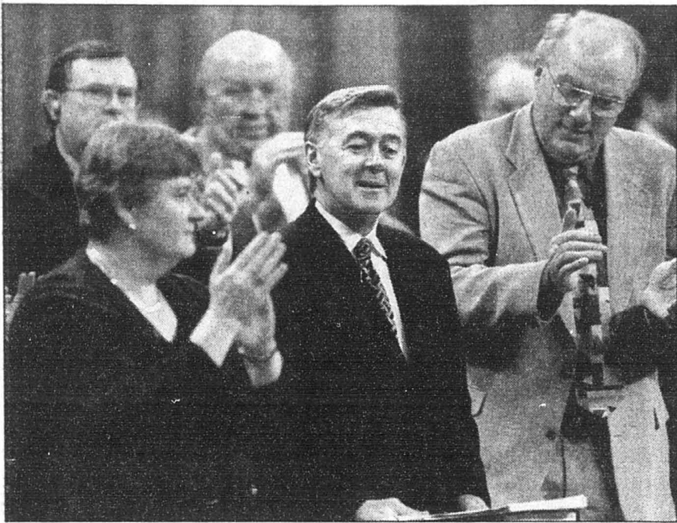
Preston Manning reproche au gouvernement de ne rien faire pour réduire la dette et les impôts.