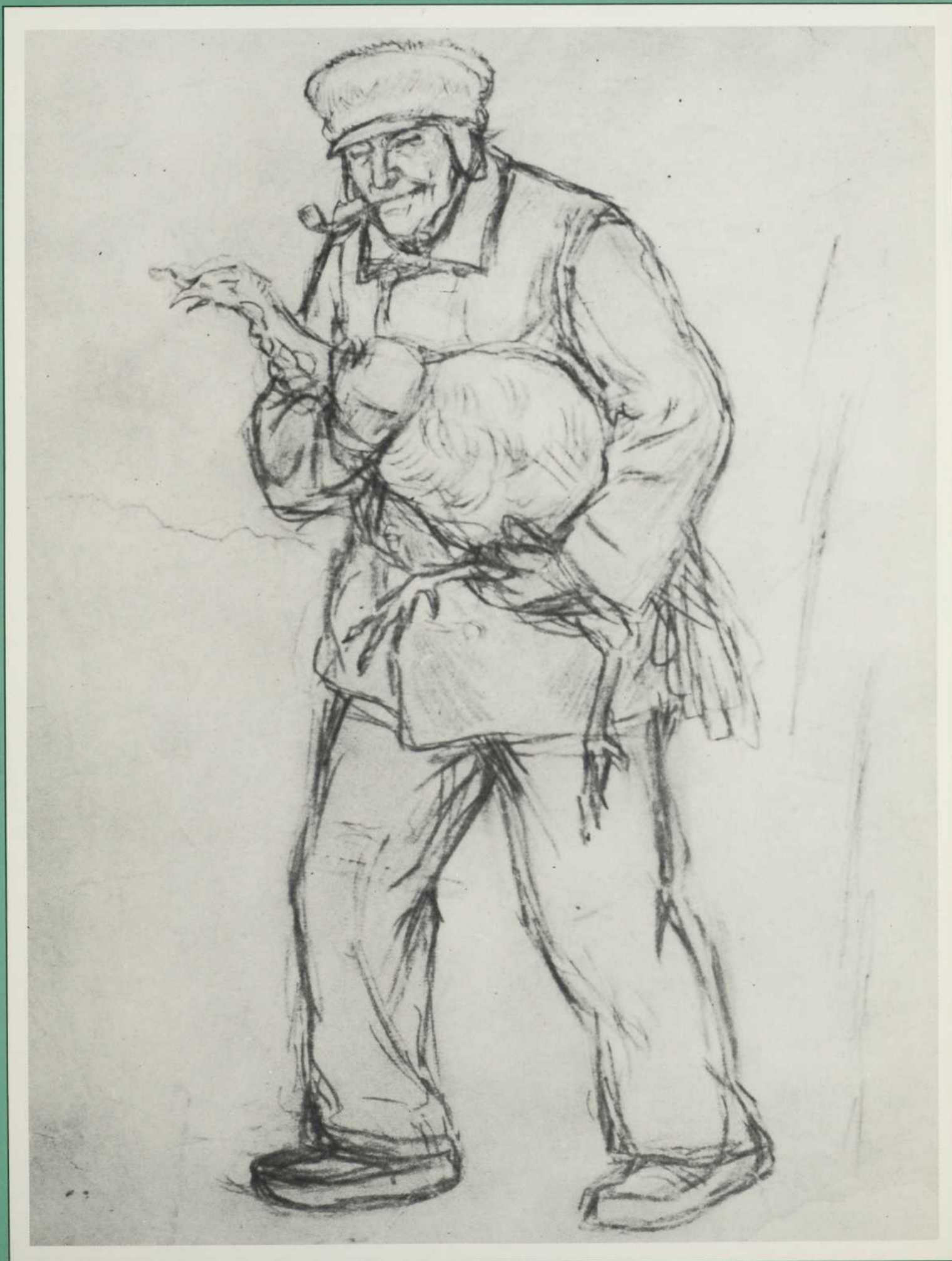
Table des marchés

BIBLIOTHÈQUE DE ✓ 29 DEC 1966 ÉCOLE DES HAUTES ÉTUDES COMMERCIALES