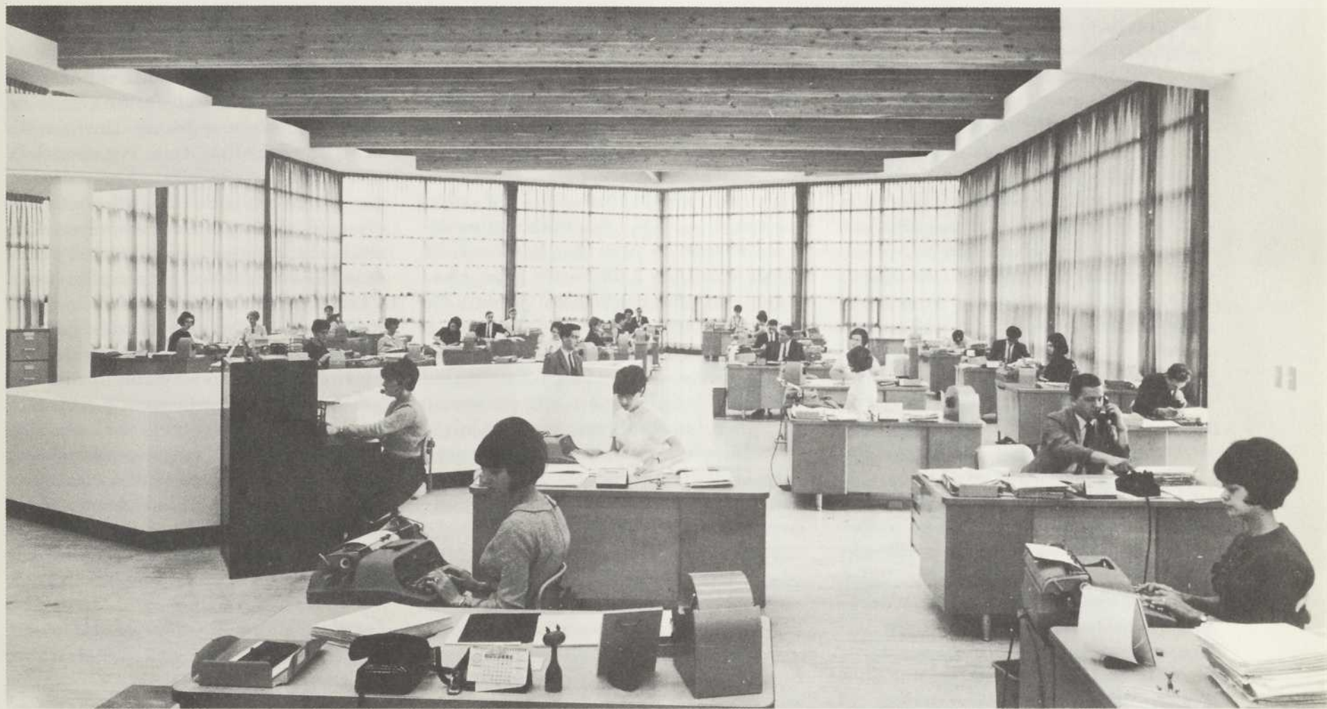
Intérieur. Les employés, dans ce bureau moderne, ne sont certes pas privés de la lumière du jour, ne manquent pas non plus d'espace...

À tous ces responsables que je viens de nommer, de même qu'aux autres qui, de près ou de loin, ont contribué à l'érection de cet édifice, je tiens à exprimer ma plus vive reconnaissance et mes remerciements les plus sincères tout en caressant l'espoir qu'ils ont déjà oublié mes sautes d'humeur occasionnelles, de même que mon impatience à voir les travaux progresser rapidement.