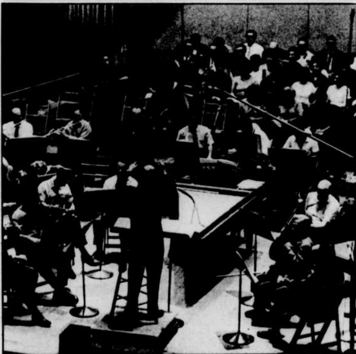
Jean BEAUDET dirige l'Orchestre de Radio-Canada à 17 heures, dimanche.