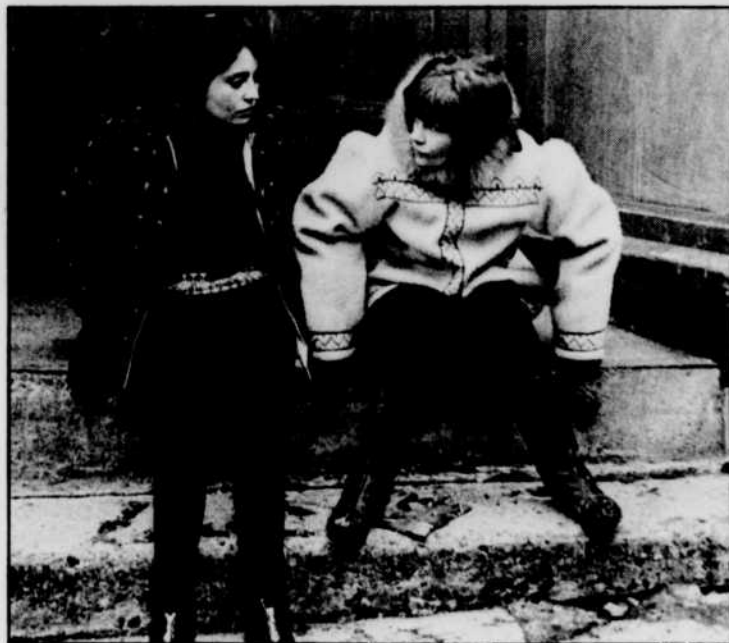
Louise MARLEAU et Geneviève BUJOLD