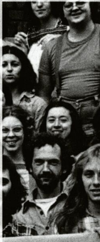
Ce qui guidait le Festival: la complicité qui s'était établie entre les praticiens. C'était en 1977...

Le ministère des Affaires culturelles du Québec est réticent. Faute de subventions, la 4e édition se transforme en une simple rencontre de trois jours, à Montréal. Pas de spectacles, mais des débats mouvementés. Les problèmes persistent lors de l'organisation du 5e. Pour être subventionné, le Festival doit se greffer à un événement canadien qui se déroule en juin; il