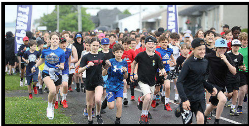
Plus de 2 000 jeunes se sont rassemblés à Saint-Agapit dans le cadre du Défi santé des Navigateurs.

de l'événement. L'accent est maintenant mis sur la réussite d'un défi et non sur la performance ou la compétition afin que tous puissent vivre leur premier événement d'envergure lié au sport de façon positive.