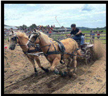
Les chevaux seront en vedette à Saint-Patrice-de-Beaurivage