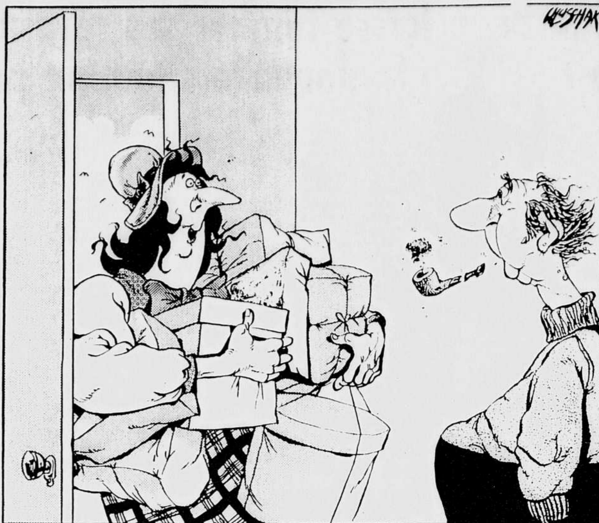
J'ai décidé de faire ma part pour combattre la récession

L'exercice de North Hatley témoigne de l'inquiétude de la population anglophone du Québec. Ils s'interrogent sur les lendemains d'un Québec souverain. Si l'expérience ne porte pas à conséquence, elle constitue une indication qu'il y a encore place à la discussion. Si la population anglophone du reste du pays devait emboîter le pas, aurait-elle plus de chance que les politiciens de convaincre le Québec de revenir à la table des discussions?