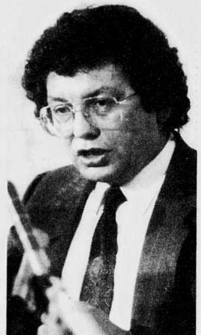
George Erasmus, chef de l'Assemblée des Premières Nations

Le premier ministre Mulroney avait déjà d'ailleurs proposé la tenue d'une vaste commission d'enquête sur les affaires autochtones quelques jours avant la date fatidique pour la ratification de l'Accord du lac Meech le 23 juin dernier, mais les autochtones avaient dit non. M. Mulroney