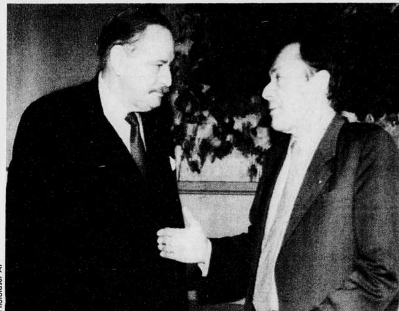
Le chef péquiste Jacques Parizeau et le premier ministre français Michel Rocard se sont entretenus, hier, durant trois quarts d'heure à l'hôtel Matignon.

«Il faut une décentralisation profonde, des changements profonds pour que les provinces puissent jouer leur rôle, que les identités des régions puissent être respectées», a-t-il dit.