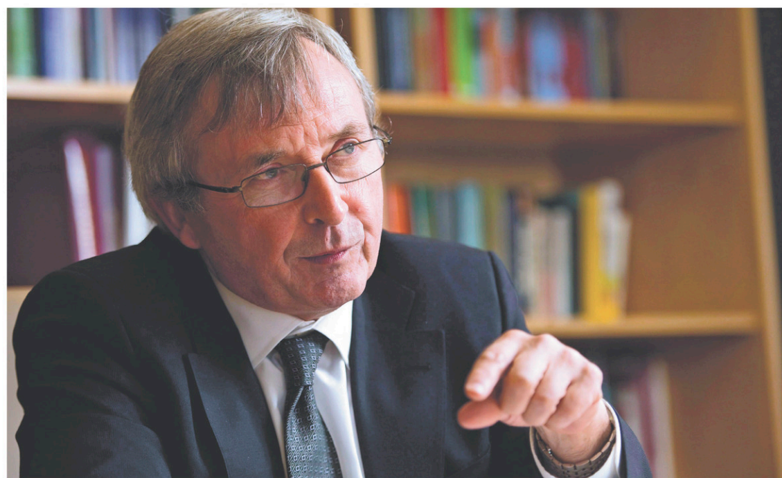
SEAN KILPATRICK LA PRESSE CANADIENNE

« La livraison des programmes de Statistique Canada est de plus en plus entravée en raison de l'approvisionnement perturbateur, inefficace, lent et hors de