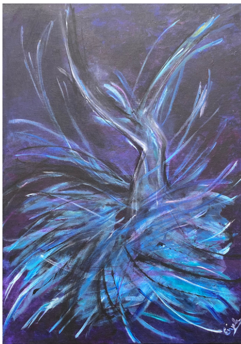
Danse gracieuse- Toile acrylique Enyla

Silencieuse, Rencontre fortuite Sournoise Sa présence Me faisait rougir Transpirer, haleter Elle menait la danse.