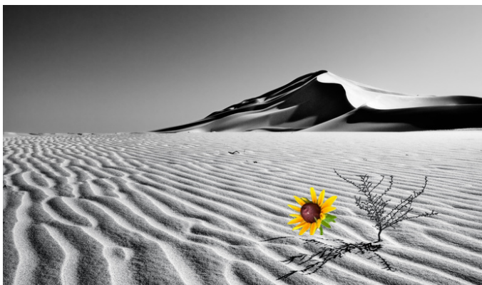
Fleuris là où tu as été plantée Bloom where your are planted

Jusqu'à ce que son sens, mon enfance en noir et blanc, se révèle à moi lors d'une présentation et que le chemin que j'avais parcouru depuis m'interpelle particulièrement. Ainsi, la lumière, la fougue, la passion et l'amour ont ensuite richement coloré le reste de ma vie.