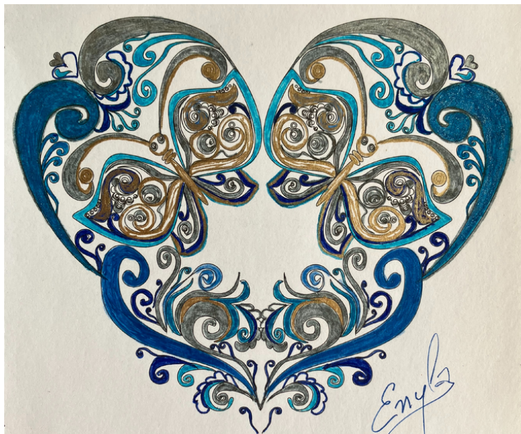
Coloriage mandala- Enyla

Germe de vie En mon sein : Allégresse, espoir Communion De corps et de sang.