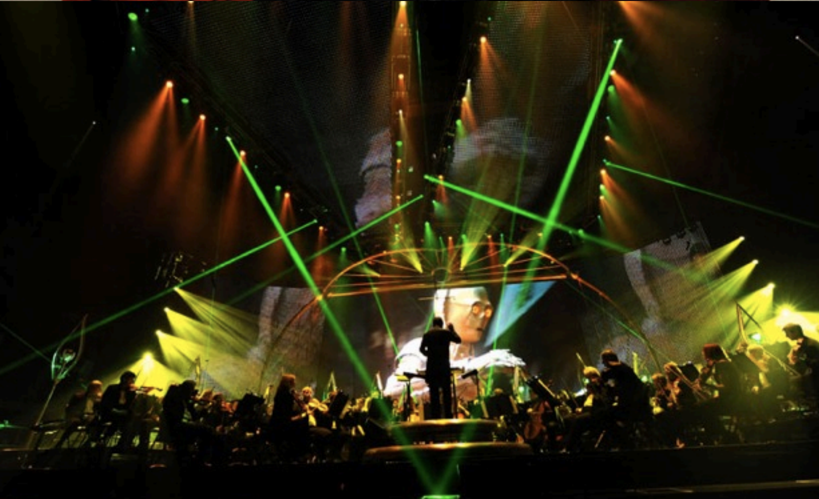
Dark Vador et sa garde, présent pendant le concert