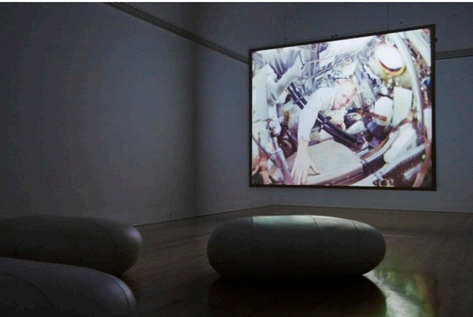
Vue de l'installation de l'exposition Entracte : films d'un futur héroïque présentée au CCA

Entracte : Films d'un futur héroïque au CCA jusqu'au 28 février 2010. Retrouvez toute la programmation des salles et des Soirées du jeudi sur www.cca.qc.ca/entracte .