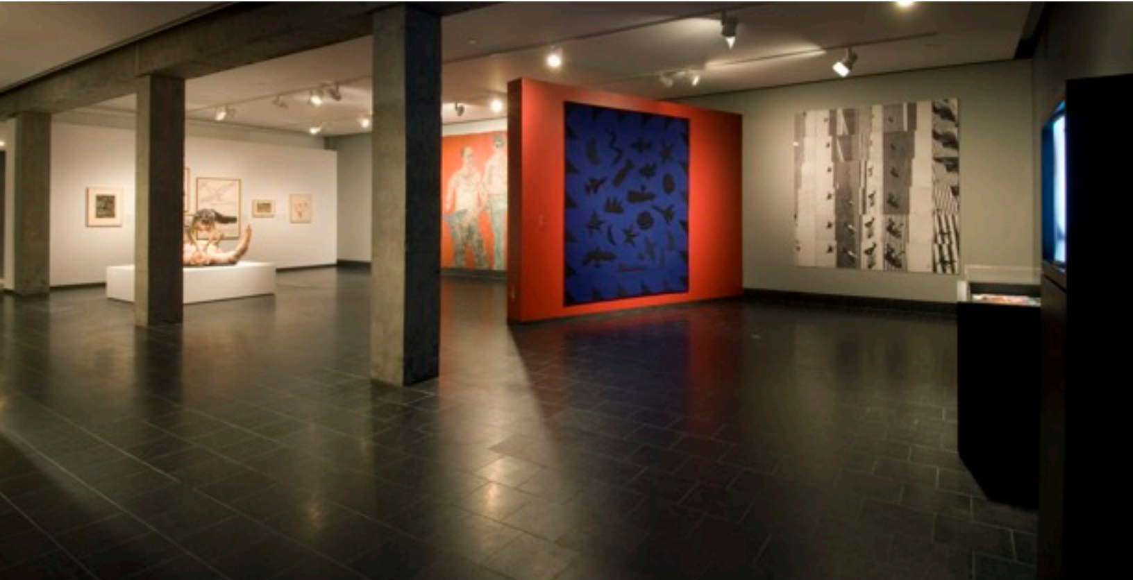
Salle d'art contemporain – Musée des Beaux-Arts de Montréal – Crédit photo : MBAM, Christine Guest, 2009