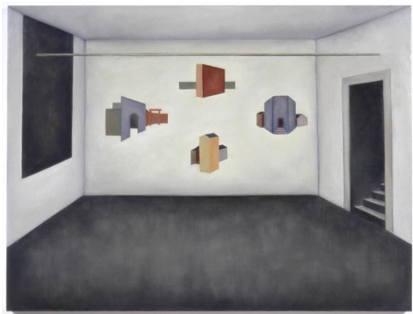
Sylvie Bouchard, Réversibilité , 2004, huile sur toile – Collection Loto Québec