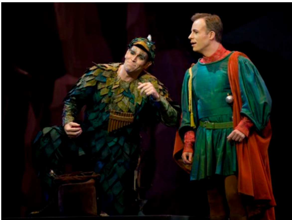
Rencontre du prince Tamino et de Papageno