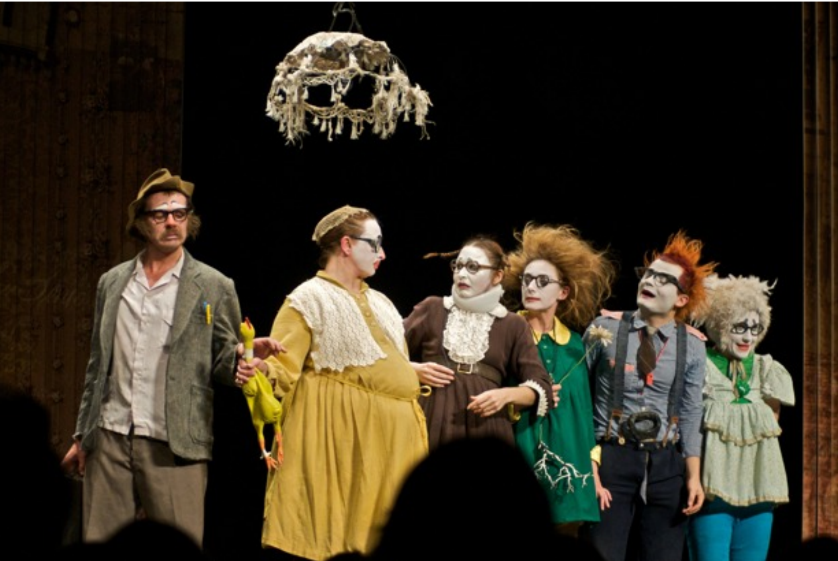
Une famille déjantée