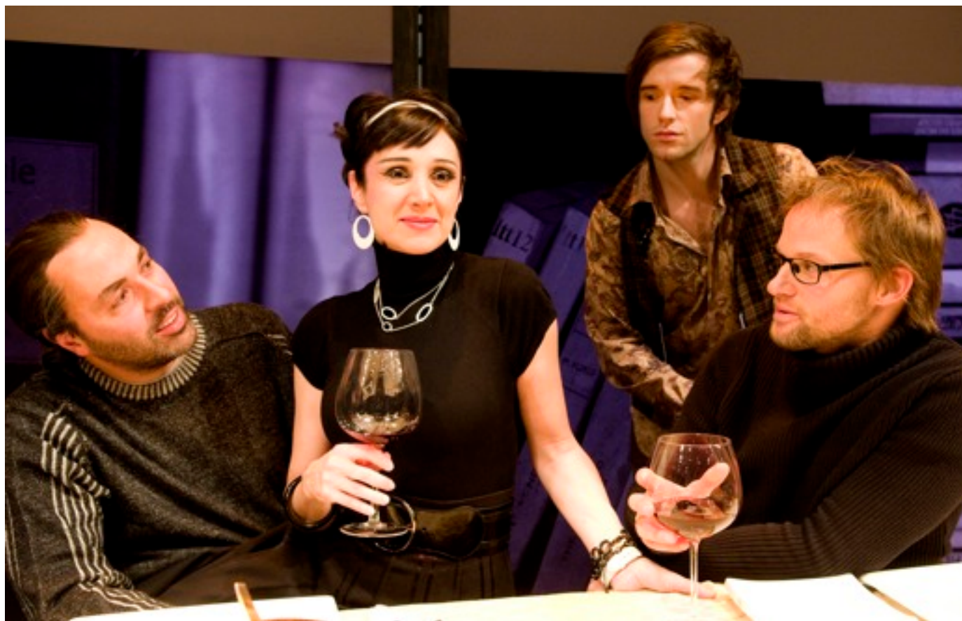
l'Imposture - Crédit photo : Yves Renaud

Pour résumer, ce fut pour moi 1 h 50 de pur plaisir théâtral. Si vous aimez le théâtre, et bien, n'hésitez pas, vous avez jusqu'au 12 décembre pour y aller !