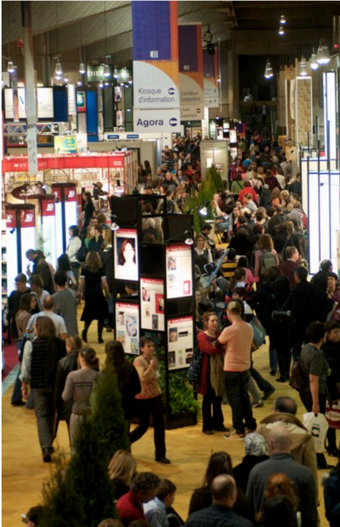
Salon du livre