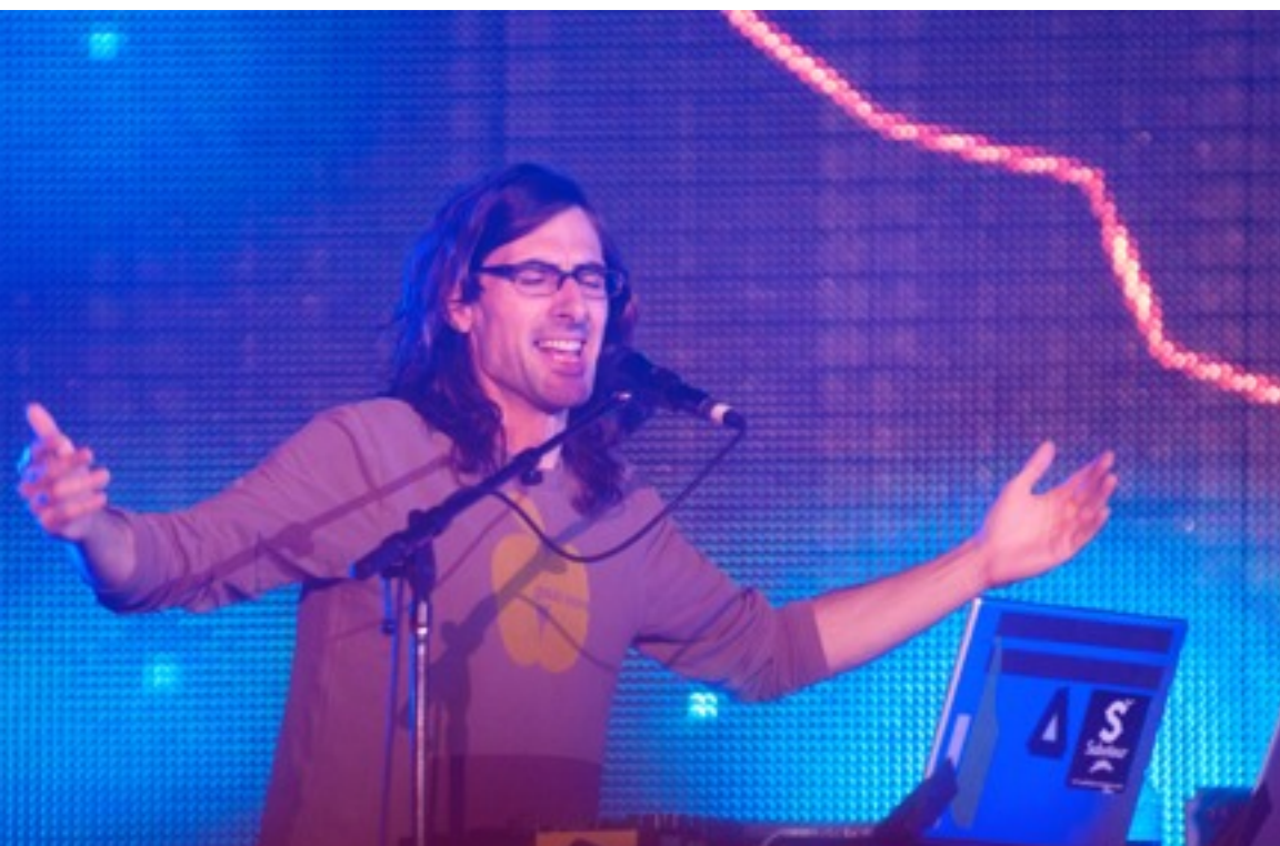
Champion mettant le feu à la foule

Espérons que DJ Champion aura appris quelques leçons de ce retour devant son public montréalais, et qu'il saura rectifier le tir en vue de la supplémentaire le 28 janvier 2010.