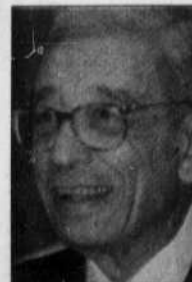
Boutros Boutros Ghali

Hier, l'ancien président béninois Émile Derlin Zinsou a annoncé sa candidature contre l'Égyptien Boutros Boutros Ghali, qui a aussi formellement confirmé mercredi être candidat à sa propre succession. «Je compte me représenter et, si je n'étais pas certain de réussir, je ne le ferais pas», dit-il. En campagne depuis janvier, le secrétaire général prétend avoir déjà recueilli le soutien de 32 pays membres de la Francophonie sur 51.