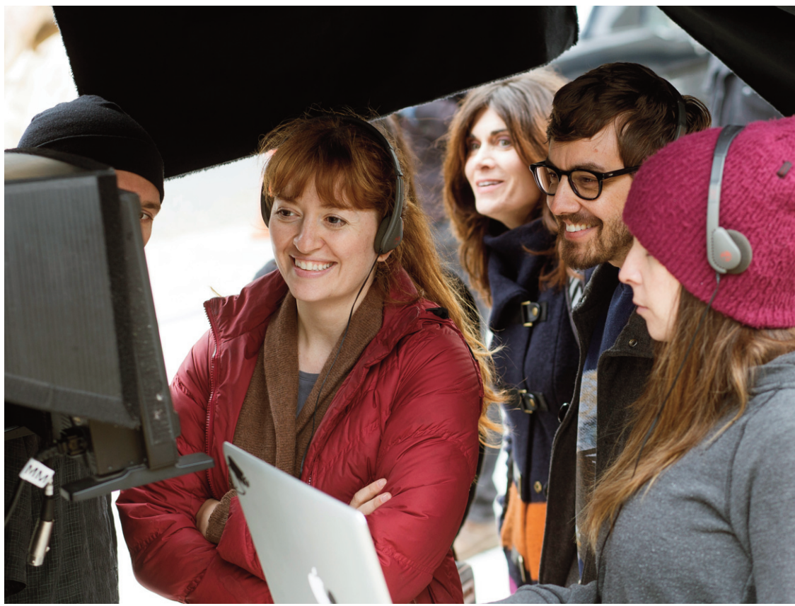
Marielle Heller a pris tout le monde par surprise avec un premier long métrage très maîtrisé.

Une actrice dans la jeune trentaine, Marielle Heller a pris tout le monde par surprise avec ce premier long métrage très maîtrisé. D'autant qu'elle