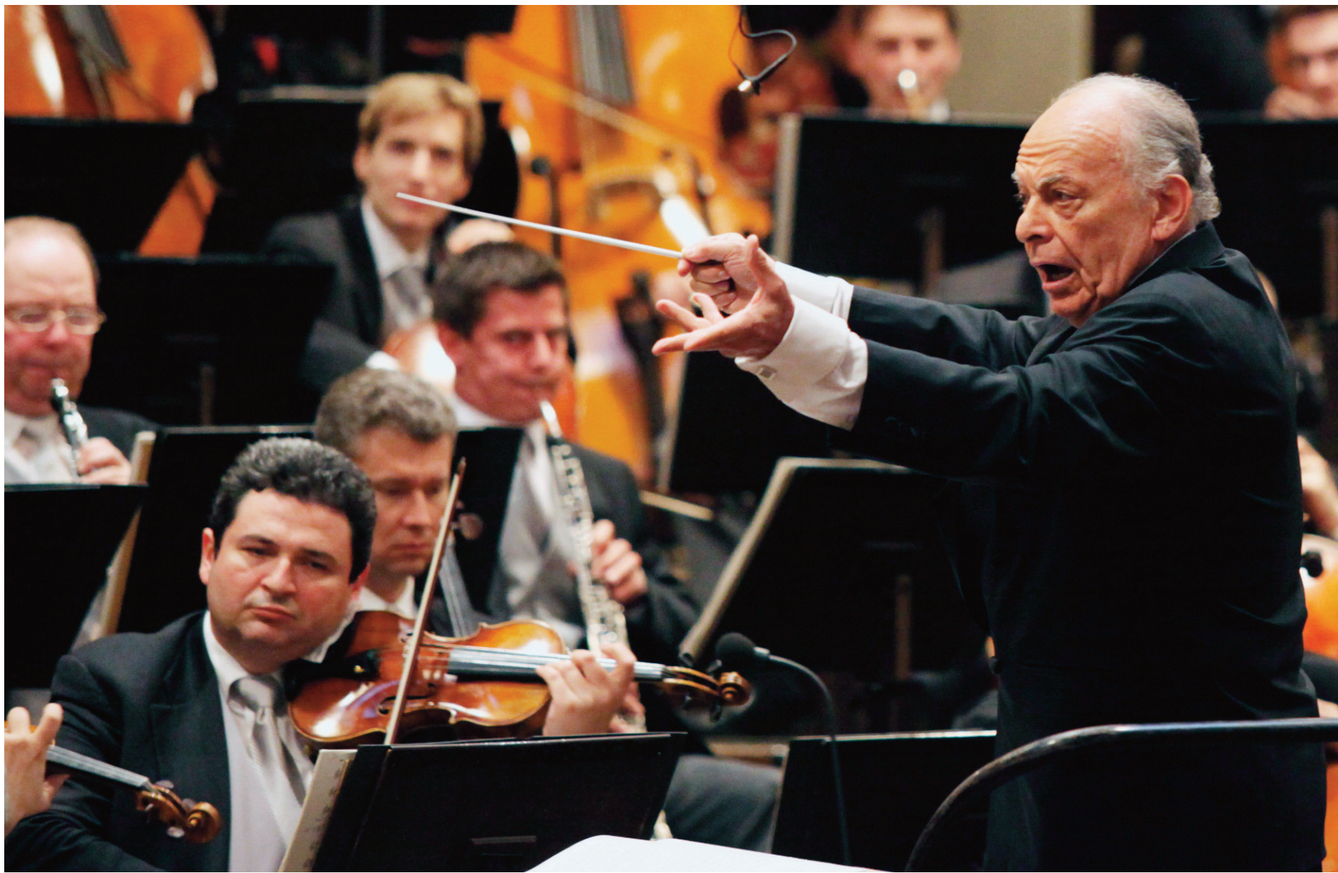
Le chef d'orchestre Lorin Maazel avait célébré son 80 e anniversaire en 2010 avec l'Orchestre philharmonique de Vienne.

Les grands chefs invités en arrivent ainsi à dupliquer leur répertoire : Bernard Haitink, avec le London Symphony, le Concertgebouw d'Amsterdam,