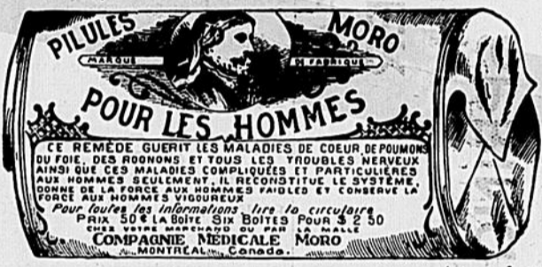
Fac-Simile exact d'une boîte de Pilules Moro.

Donnez-nous un homme brisé par les excès, la dissipation, un travail trop dur, les tracas, ou par toute autre cause qui ait sapé sa vitalité, avec les Pilules Moro nous le rendrons aussi vigoureux en tous points, que n'importe quel homme de son âge.