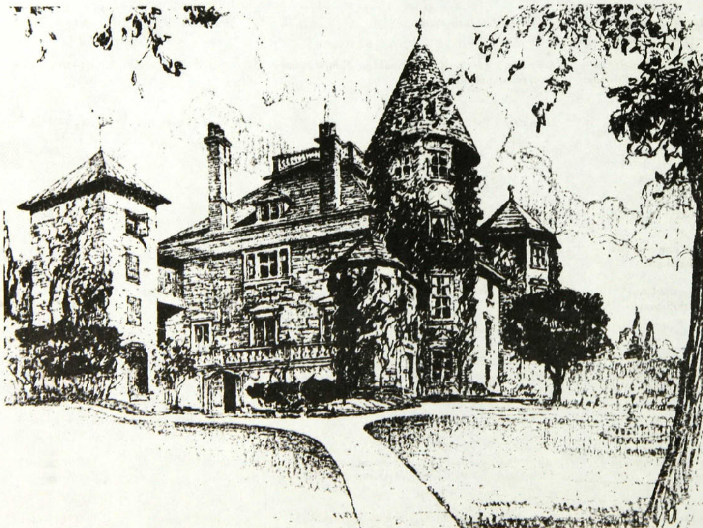
Le Manoir Papineau.