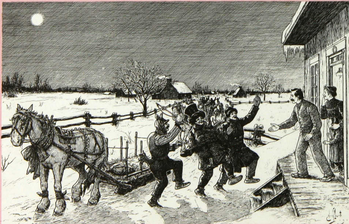
Le Mardi gras à la campagne.