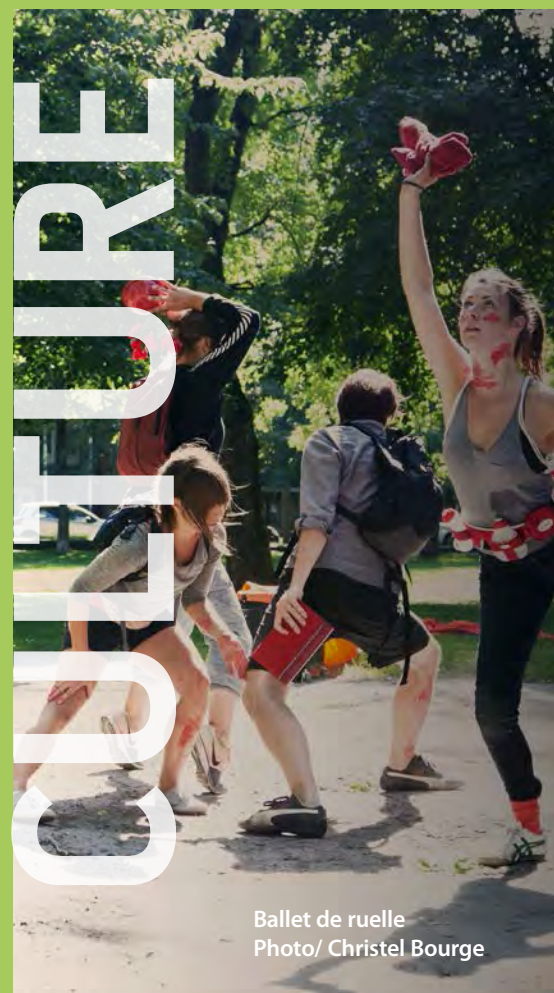
Ballet de ruelle

7-9 ans | Lundi de 18 h à 19 h - 65,75 $* 10-13 ans | Lundi de 19 h à 20 h - 65,75 $*