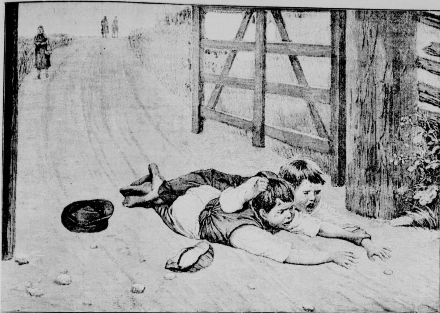
BEAUX-ARTS. — POUR UN CENTIN