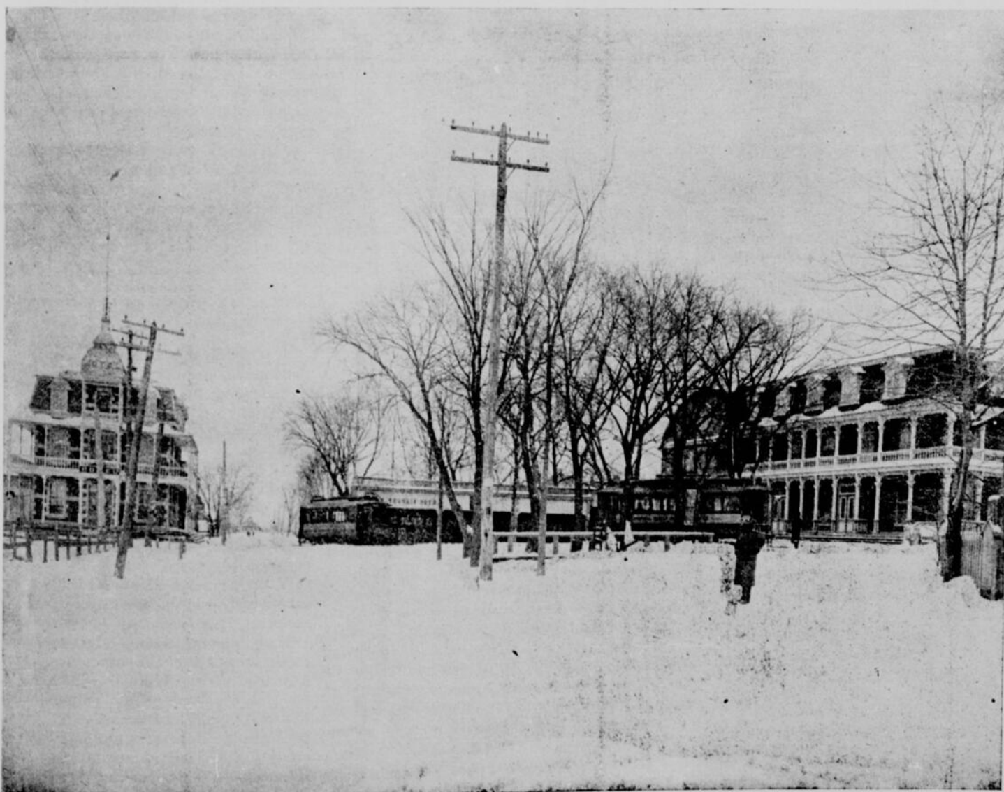
LE CHEMIN DU SAULT-AU-RECOLLET. — LES CHARS ÉLECTRIQUES PASSANT PRÈS DE L'HOTEL VERRAIS