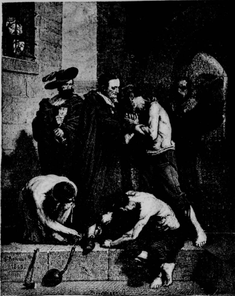
SAINT VINCENT DE PAUL PREND LES FERS D'UN GALÉRIEN AU BAGNE DE MARSEILLE

Saint Vincent de Paul, l'ami de tous ceux qui souffrent, s'est dévoué aux galériens héroïquement, et il lui est arrivé une aventure que l'on a jamais percer complètement.