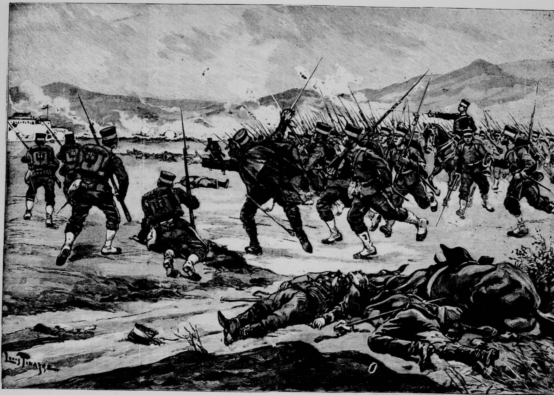
LA GUERRE SINO JAPONAISE — L'ARMÉE JAPONAISE, APRÈS LE PASSAGE DU FLEUVE VALU, ATTAQUE L'AILE GAUCHE DE L'ARMÉE CHINOISE