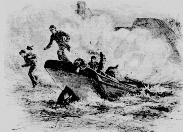
La torpille éclata pendant que le canon tonnait à bord.

Le Congrès vota 5,000 dollars pour faciliter les tentatives de Fulton. Faut-il rappeler ses inventions de " double torpille " poussée, au moyen d'un espars, sous la carène d'un navire,