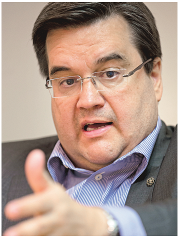
Denis Coderre