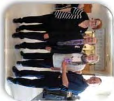
50 ans mariage