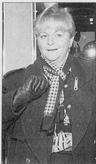
Les principaux acteurs du psychodrame que ne manque jamais de provoquer le retour des négociations dans le secteur public avaient rendez-vous hier. Dans le sens des aiguilles du montre, en commençant par la photo du haut à gauche: Clément Godbout, président de la FTQ, le premier ministre Lucien Bouchard, la présidente de la CEQ, Lorraine Pagé, et le président de la CSN, Gérald Larose.