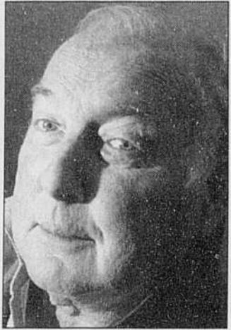
Le cinéaste Pierre Perrault